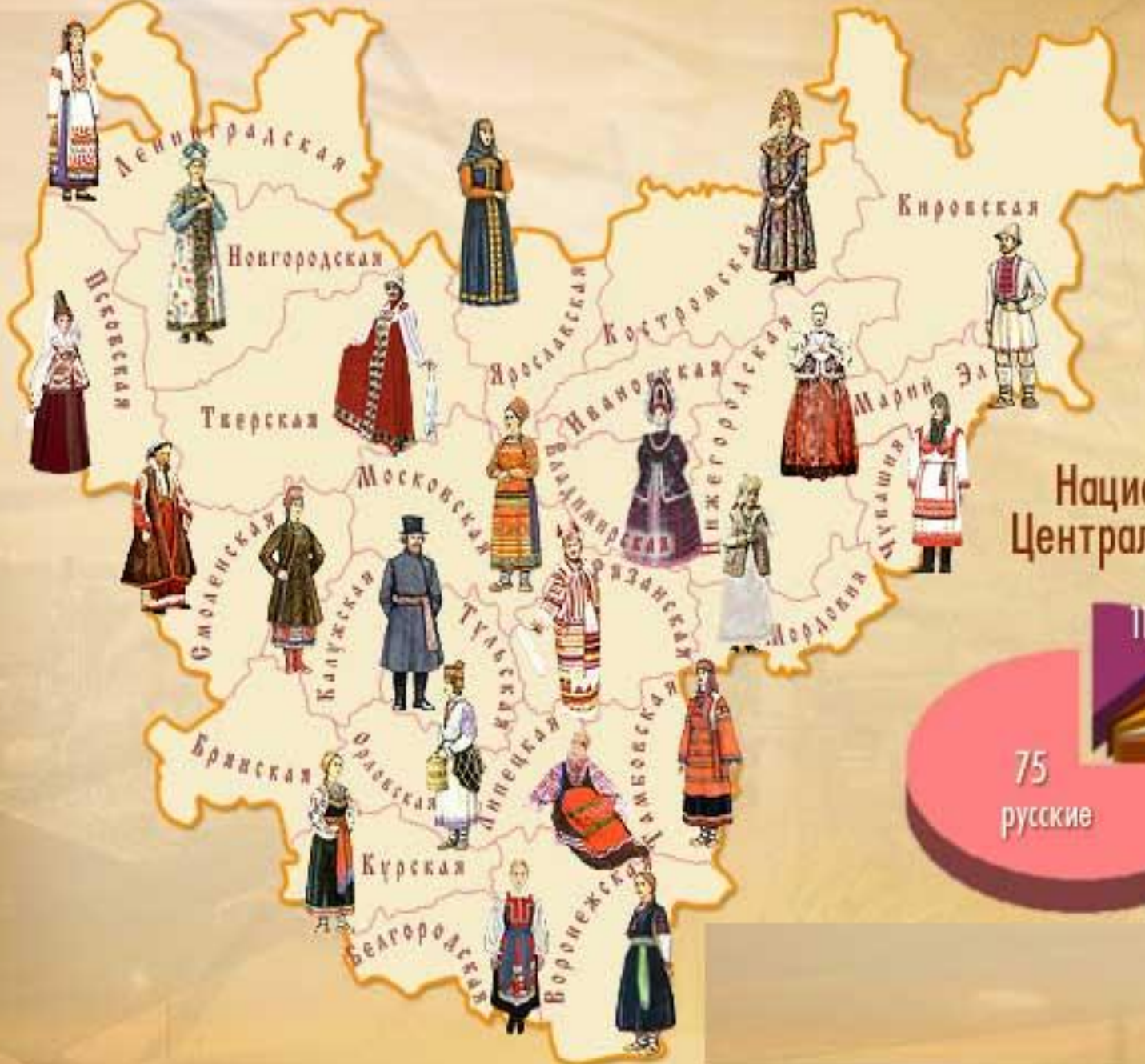
Национальный состав Центральной России, %