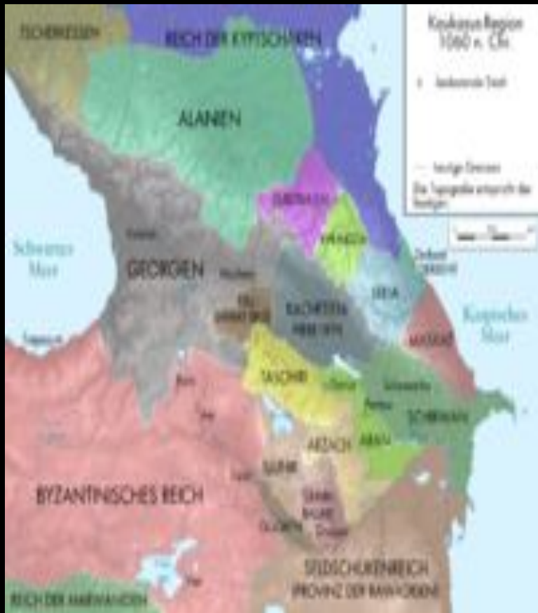
Племенное объединение Дзурдзуки (фиолетовый цвет)

В период Средних веков Существовало до нашей эры на объединение племён Дзурдзуки. Она распространена Кабанская культура, получившая свое название по слову Кобан (Тагаурское ущелье, Северная Осетия), где были найдены древнейшие археологические население переселилось в горы. Первые упоминания о противах и скинских племенах на Северном Кавказе появляются в христианстве со стороны Грузии.