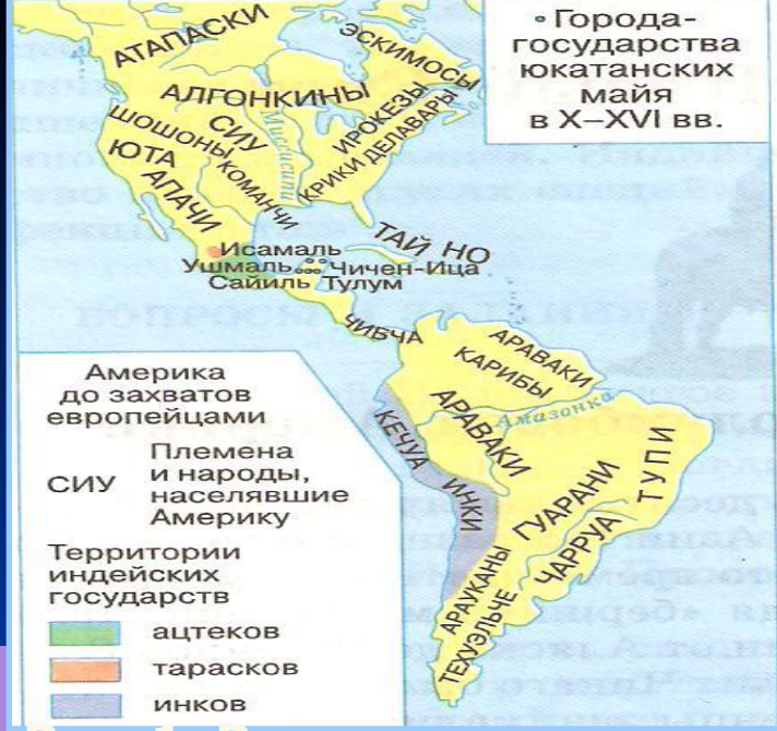
Рис. 1. Расселение индейцев до прихода европейцев

Север Северной Америки и юг Южной (как районы с более суровыми условиями) имеют преобладающее белое население .