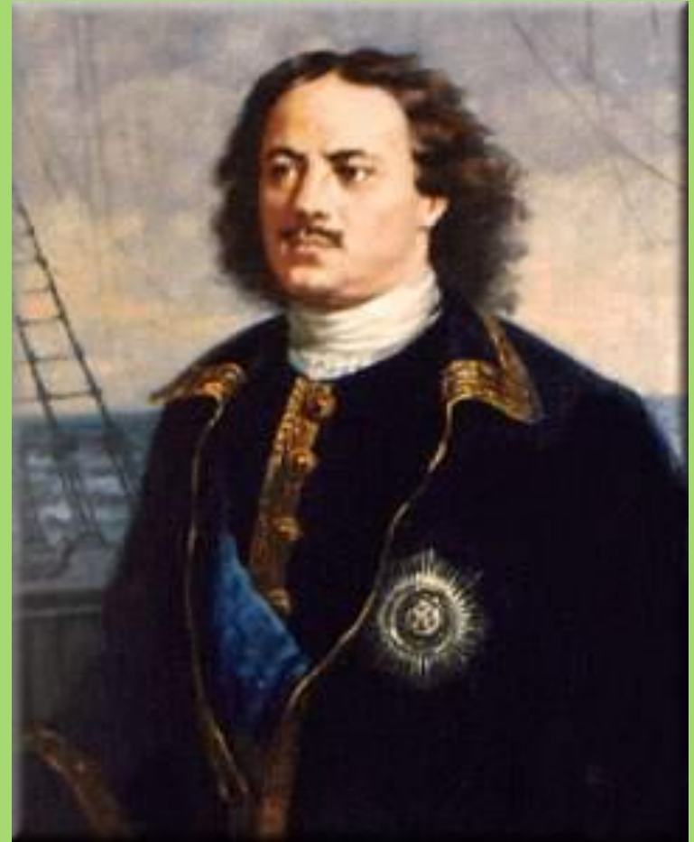
Царь Петр Первый – основатель города