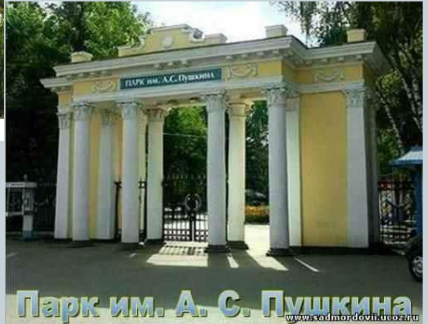
Парк им. А. С. Пушкина www.sadmordovii.ucoz.ru