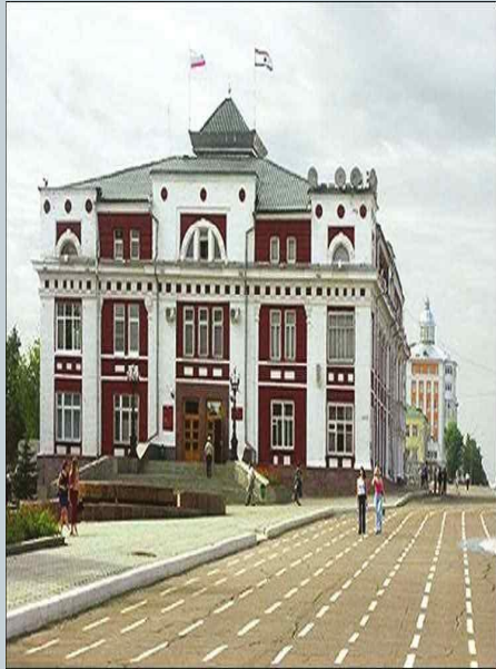
Здание городской администрации в Саранске