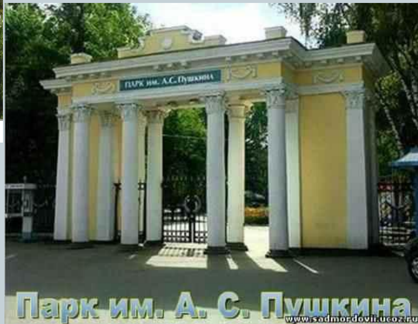
Парк им. А. С. Пушкина