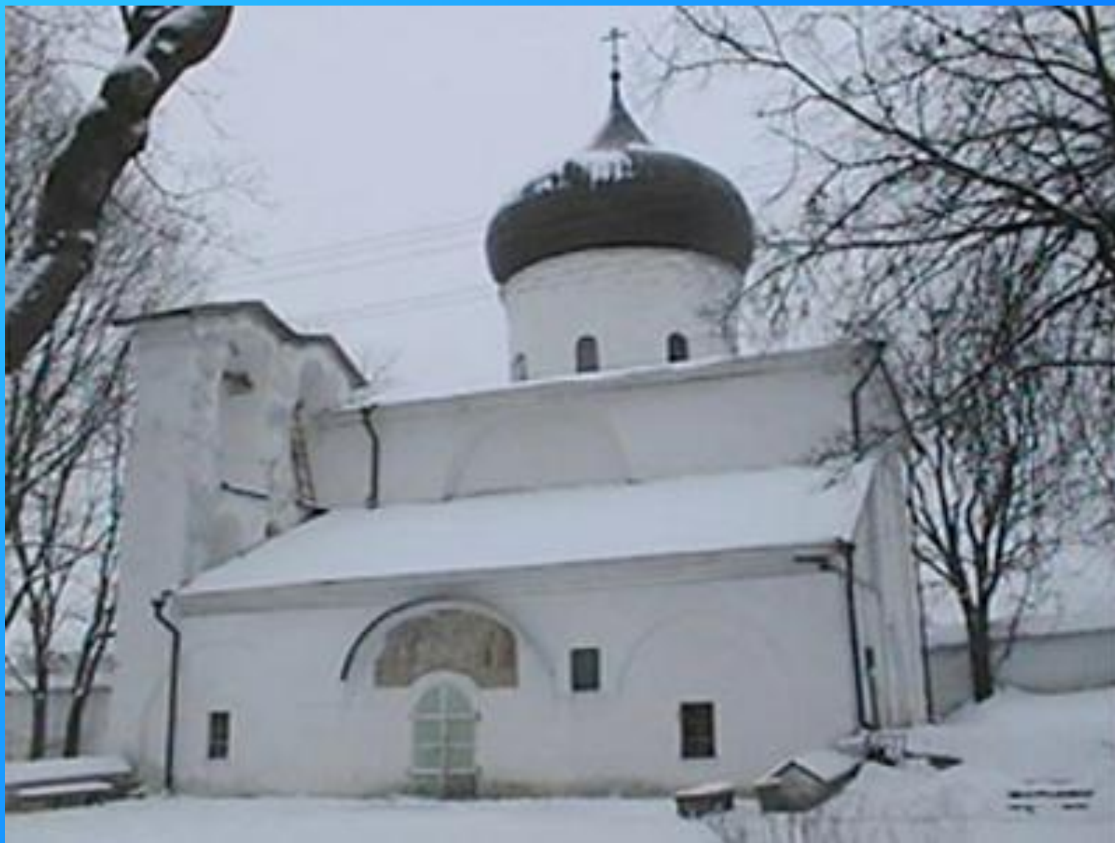
Спас-Мирожский монастырь (г.Псков)