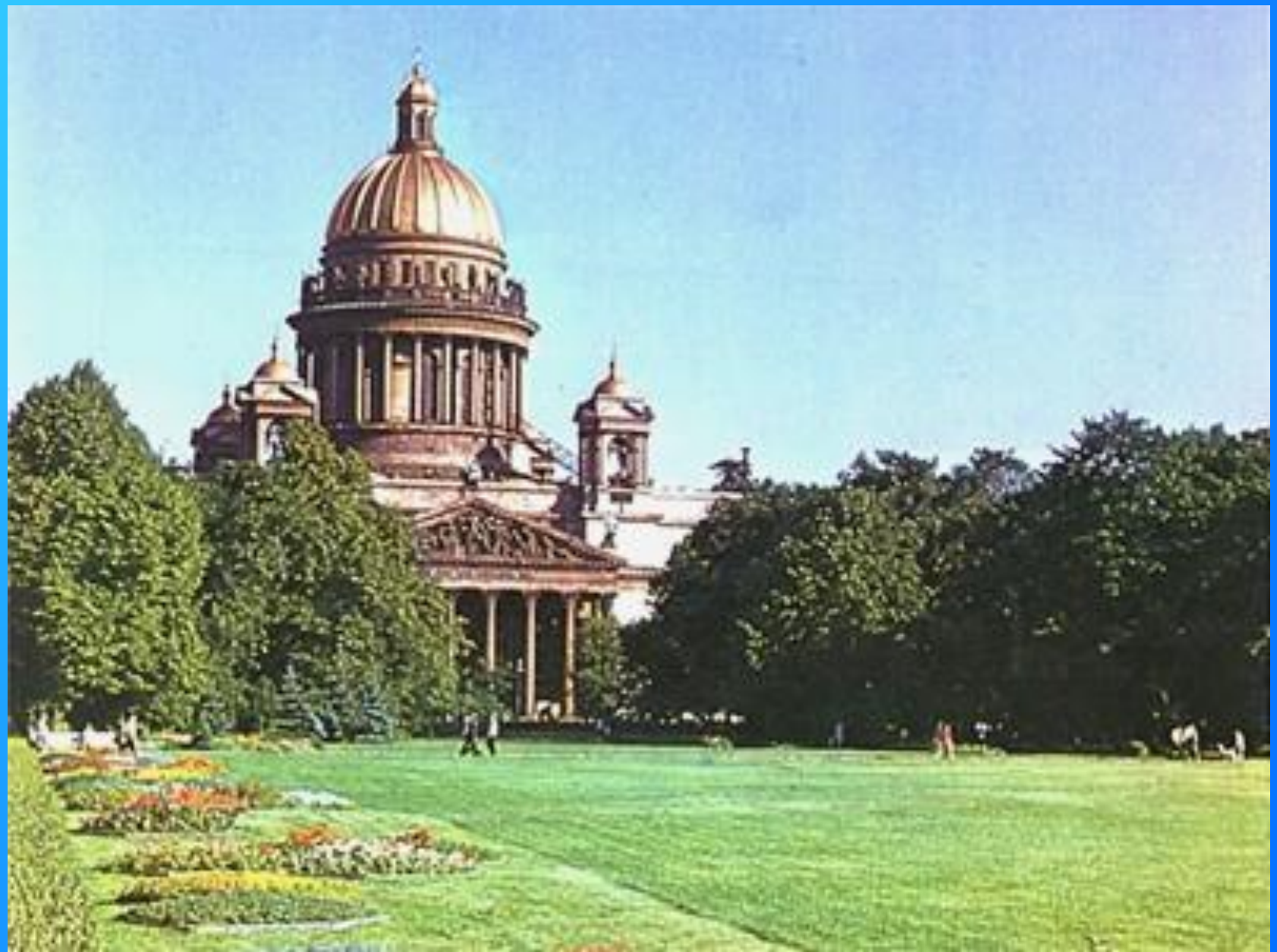
Исаакиевский собор. Санкт-Петербург.