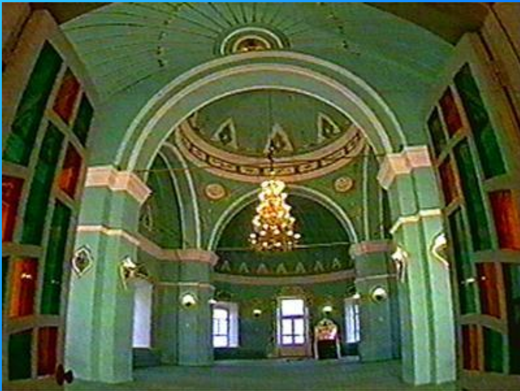
Татарстан. Мечеть Нурулла в Казани.