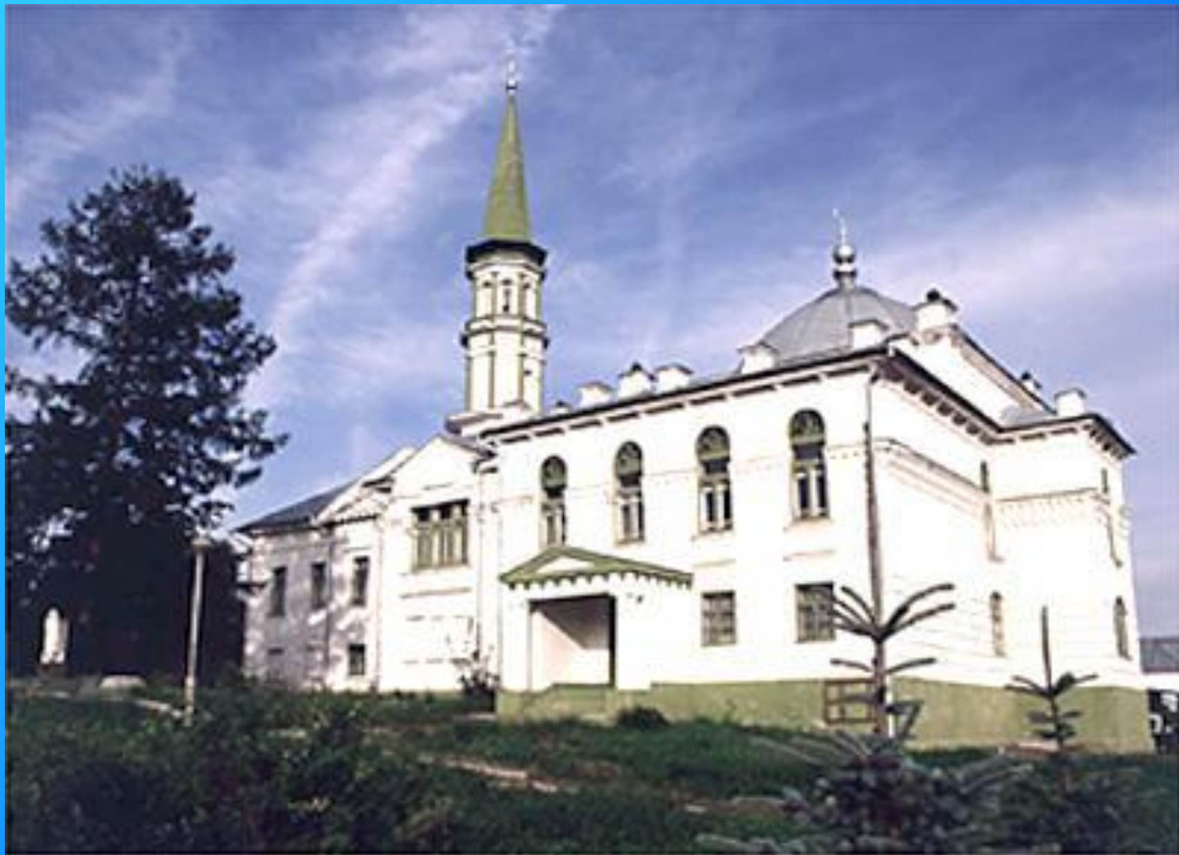
Башкортостан. Мечеть в окрестностях Уфы.