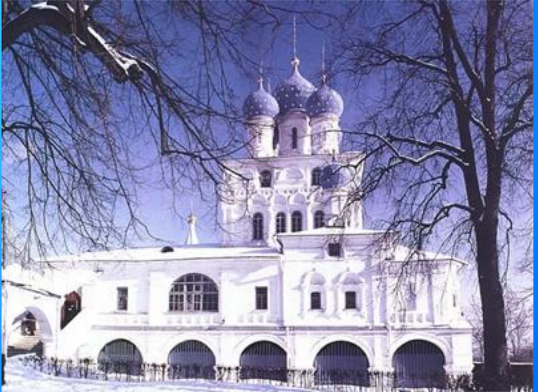
Казанская церковь. Коломенское. Москва.