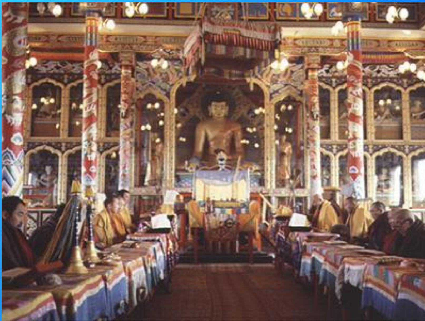
Республика Бурятия. Во время религиозных праздников в Иволгинском дацане.