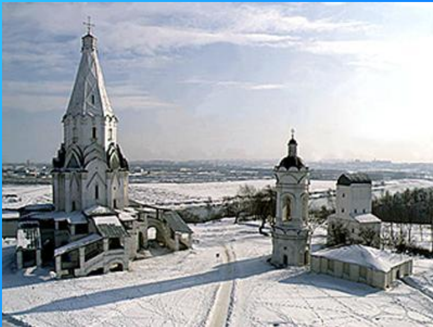
Церковь Вознесения и колокольня Св. Георгия Победоносца. Коломенское. Москва.