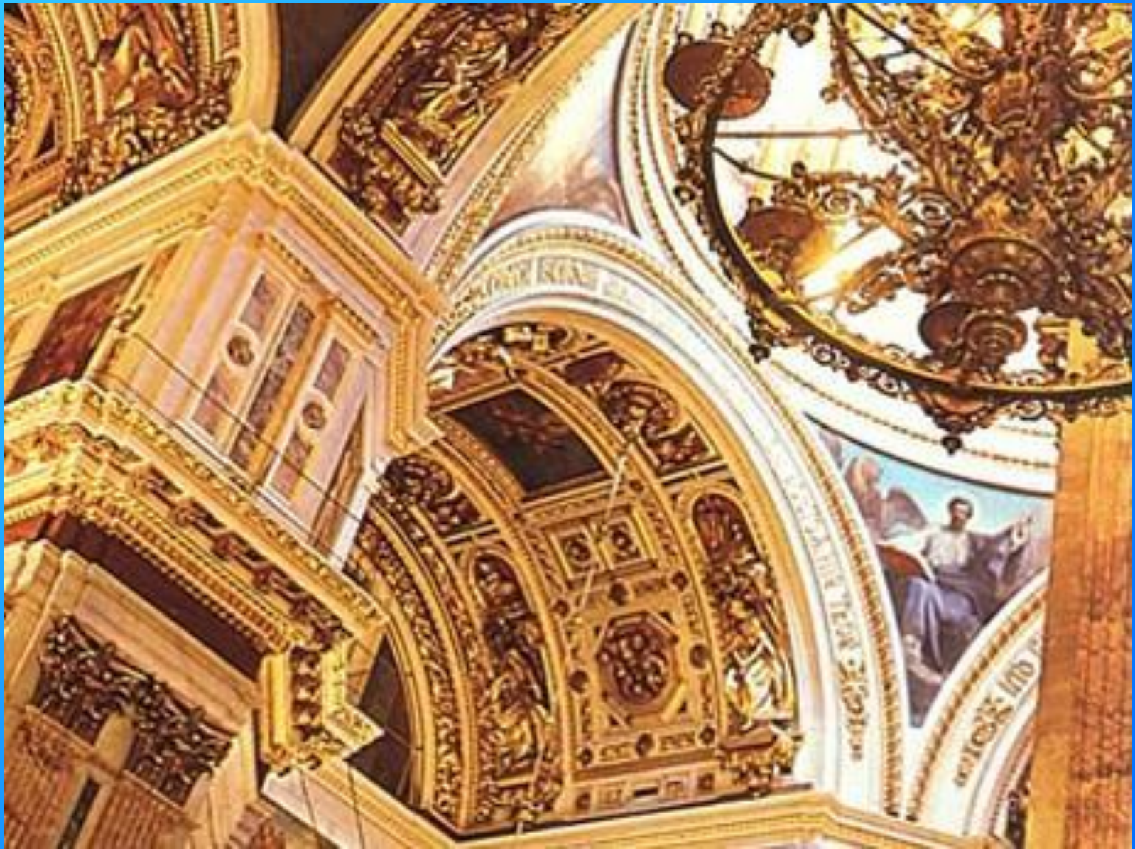
В Исаакиевском соборе. Фрагмент.