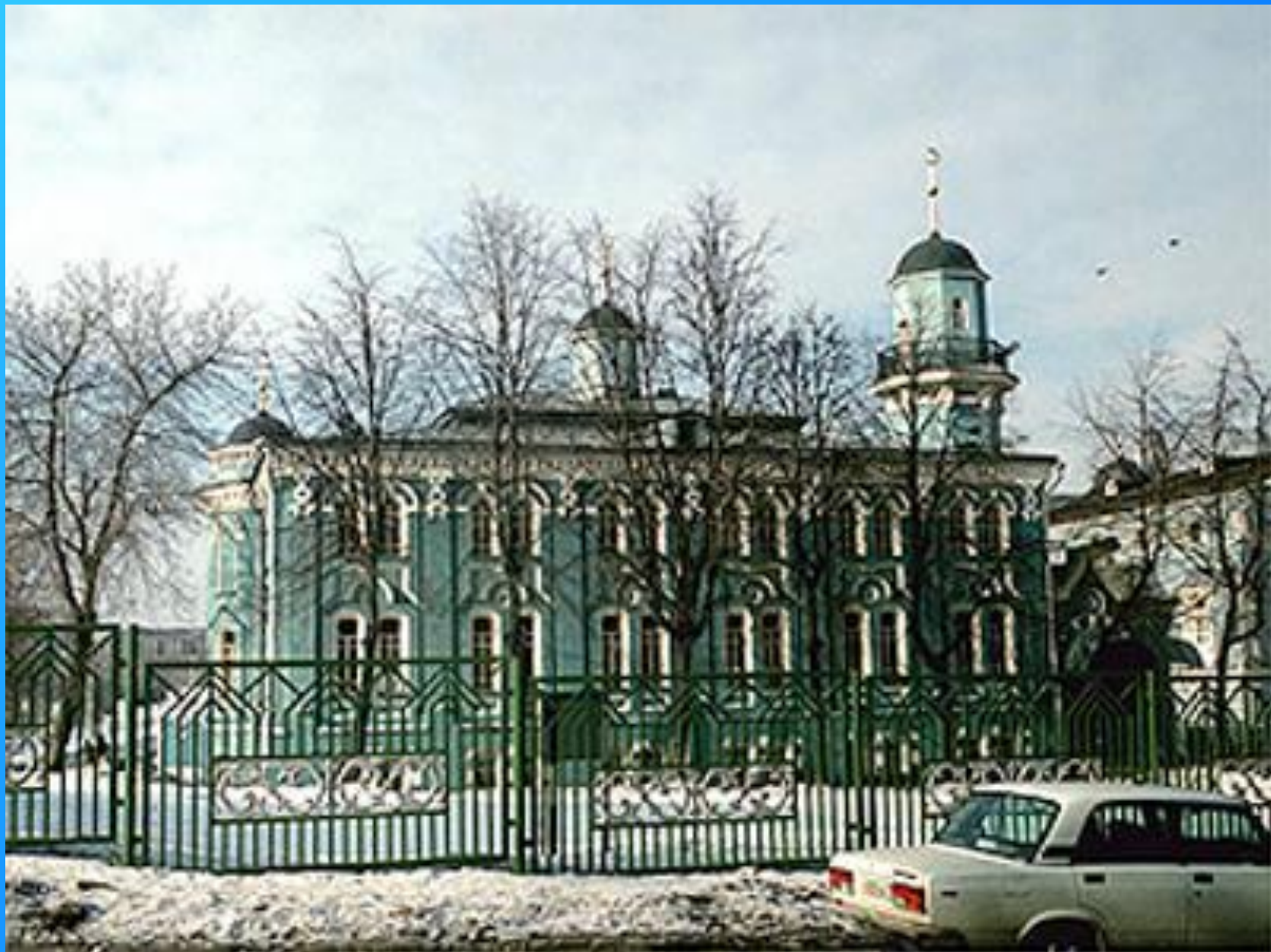
Московская соборная мечеть