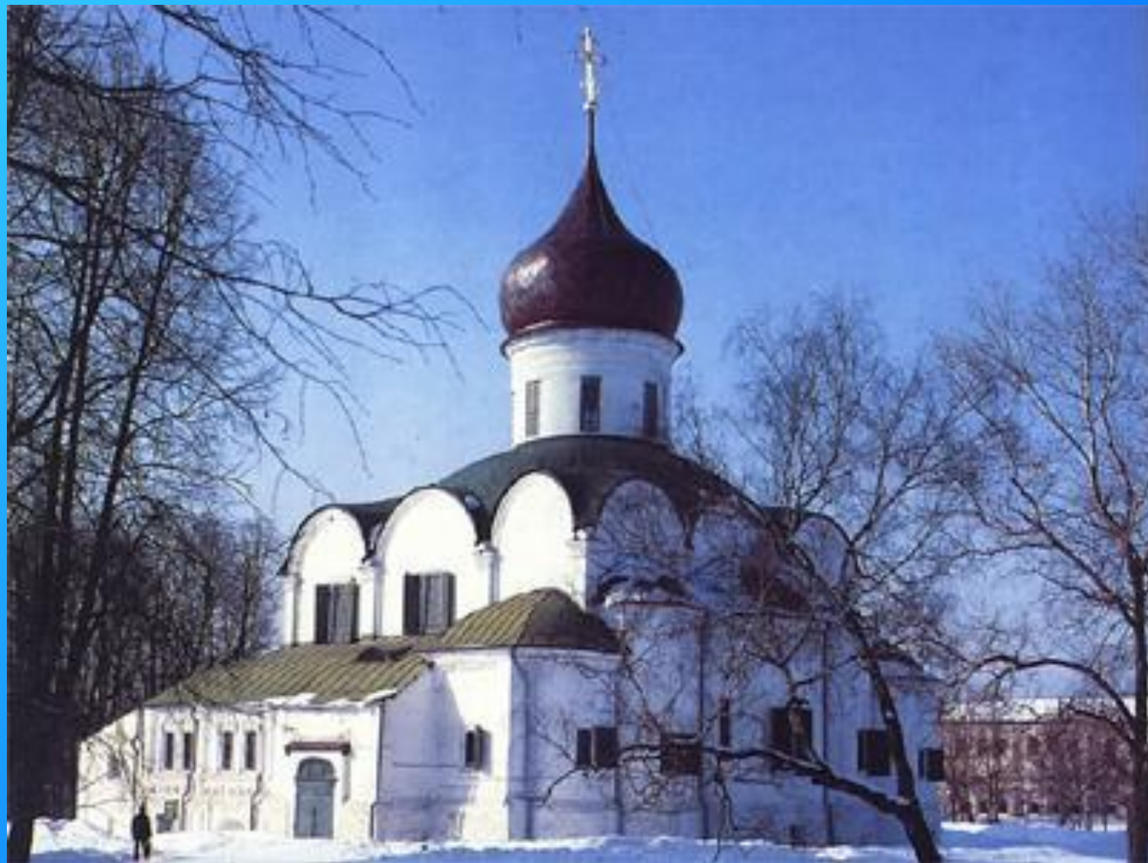
Троицкий собор. Александров.