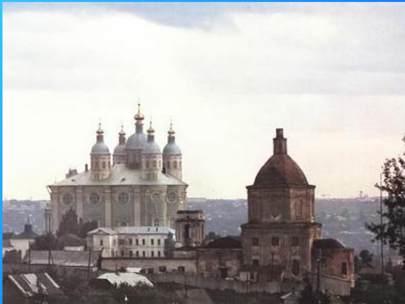
Успенский собор. Смоленск.