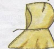
Охотничья шапка "пурук"