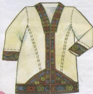
Мужской халат "шабыр"