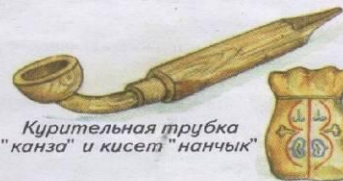
Курительная трубка "канза" и кисет "нанчык"