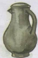
Чугунный кувшин "роче"