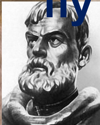
Семен Иванович Дежнев