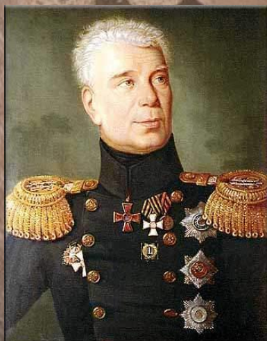
Иван Федорович Крузенштерн