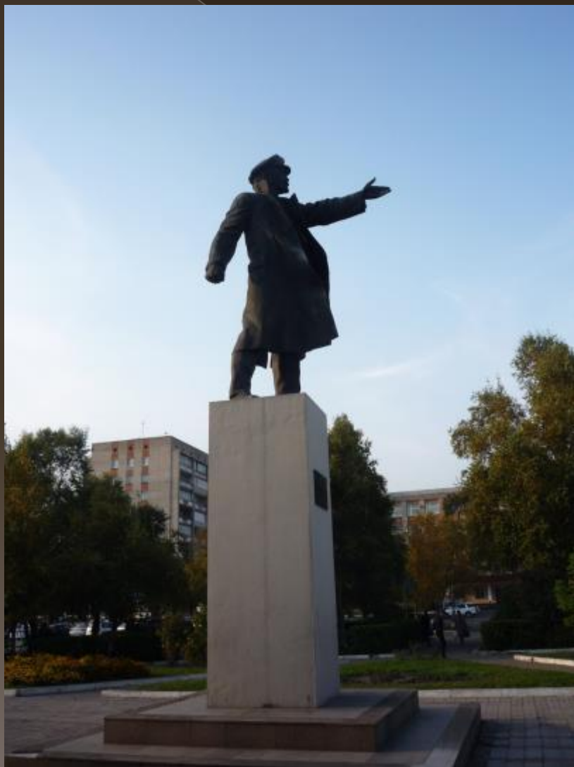
Памятник В. И. Ленину