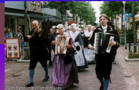
Rein Spoorman/Pan Records