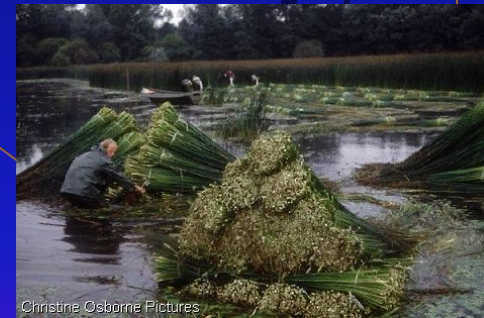
Christine Osborne Pictures