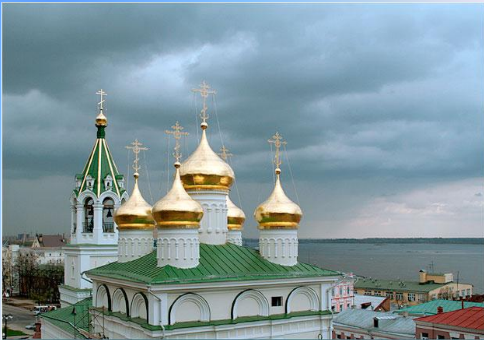
Церковь Иоанна Предтечи