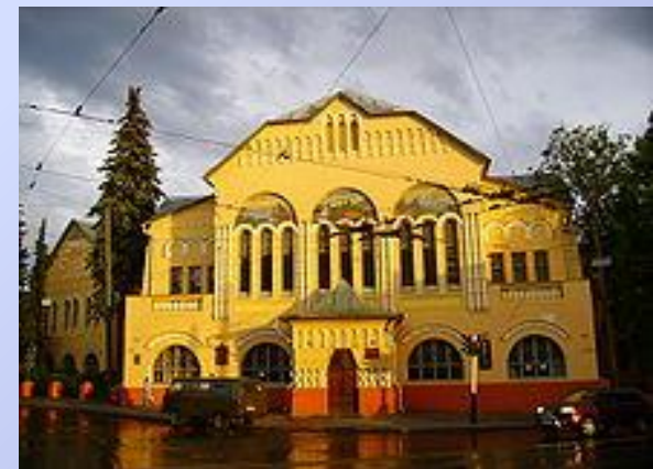
Дворец Детского творчества им. Чкалова