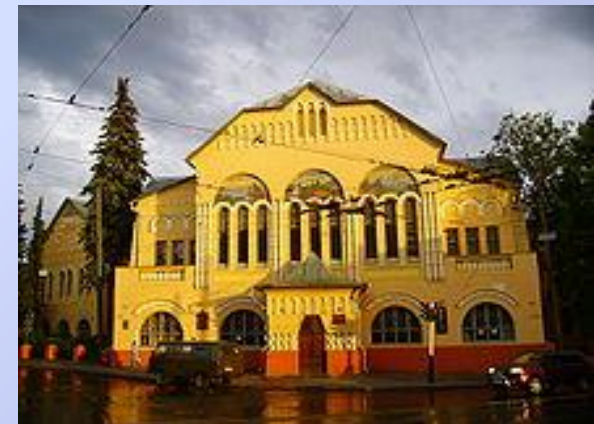
Дворец Детского творчества им. Чкалова