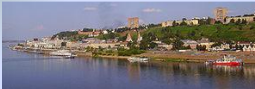
Вид на центр города с Канавинского моста