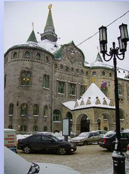
Государственный банк на Большой Покровской улице

В историческом центре города расположен каменный кремль начала XVI века — двухкилометровая кирпичная крепость с 13 сторожевыми башнями. На территории Кремля находится Михайло-Архангельский Собор, построенный в середине XVI века. Так же сохранились многочисленные памятники деревянного зодчества.