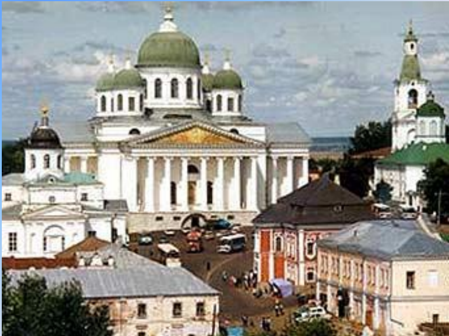
Вид на Арзамас - город-спутник