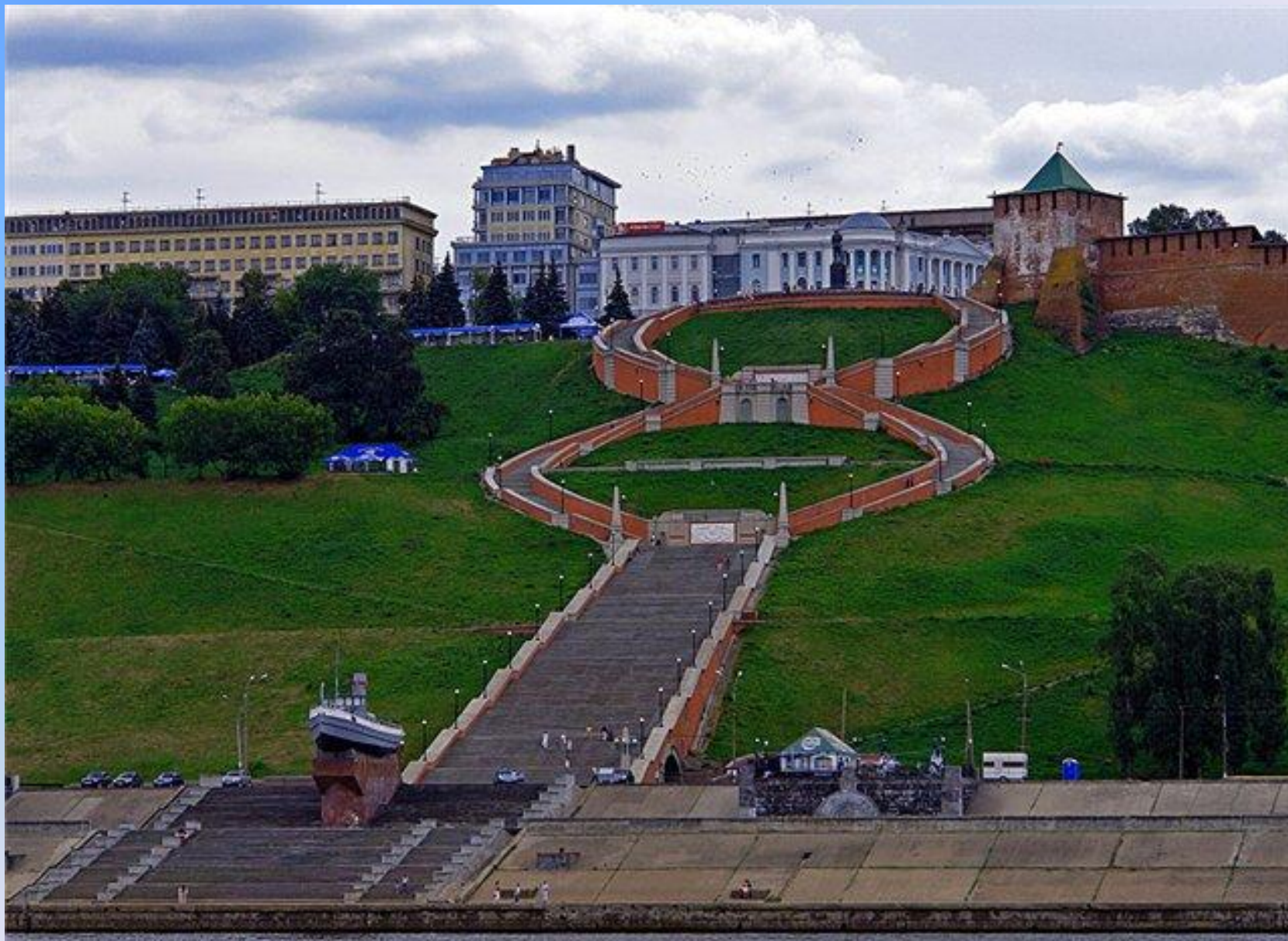
Вид на Кремль. Спуск к набережной реки Волга