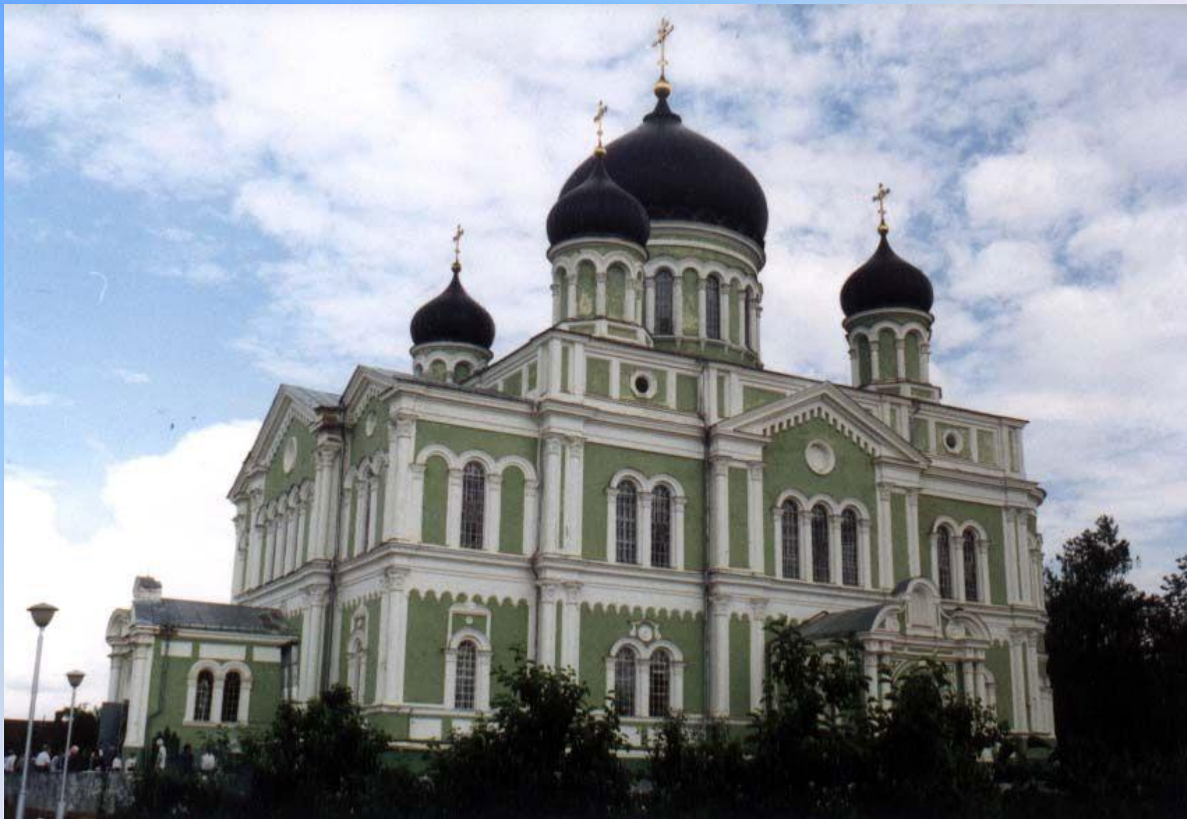
Церковь в Дивеево