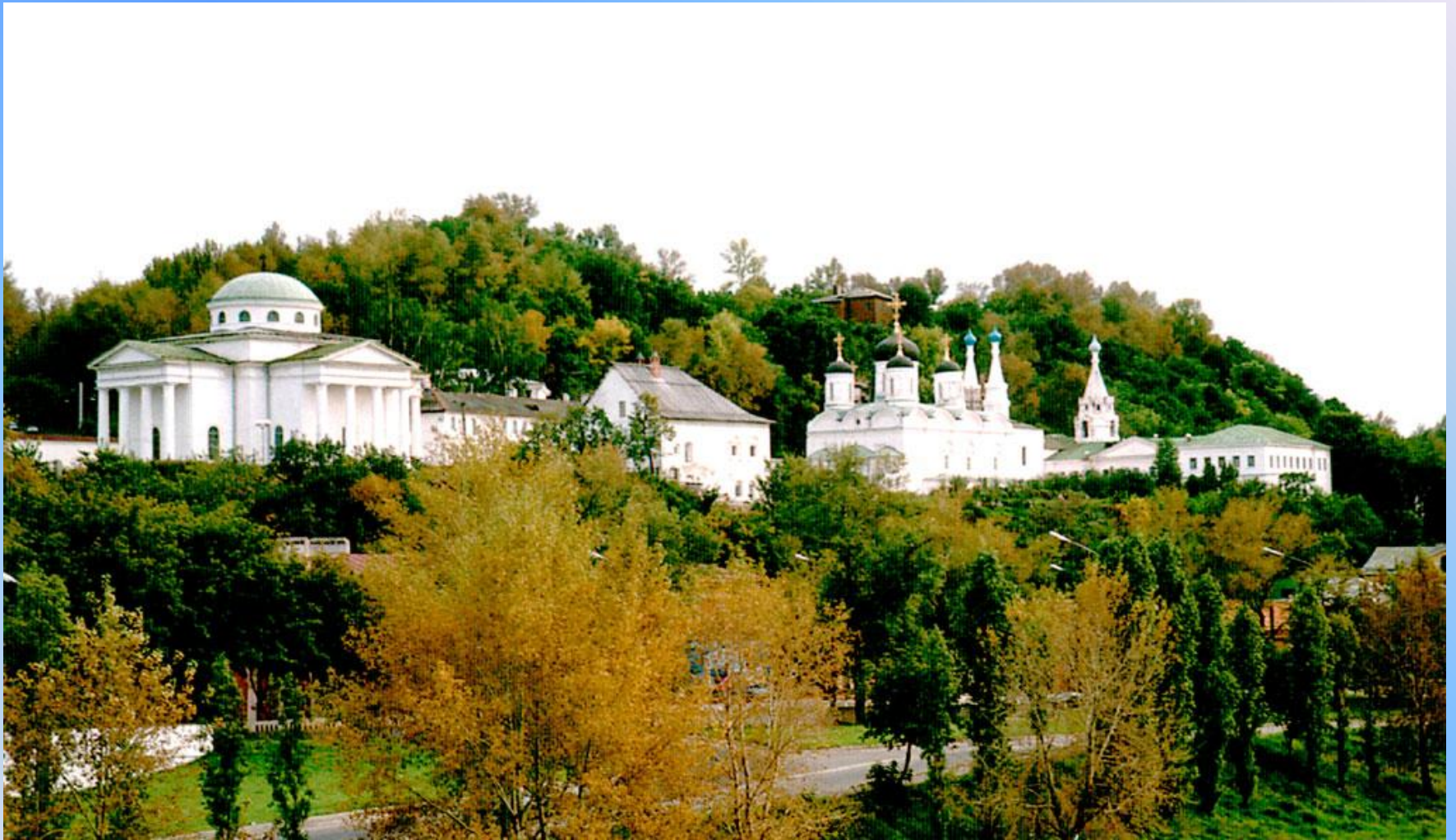
Монастырь в Дивеево