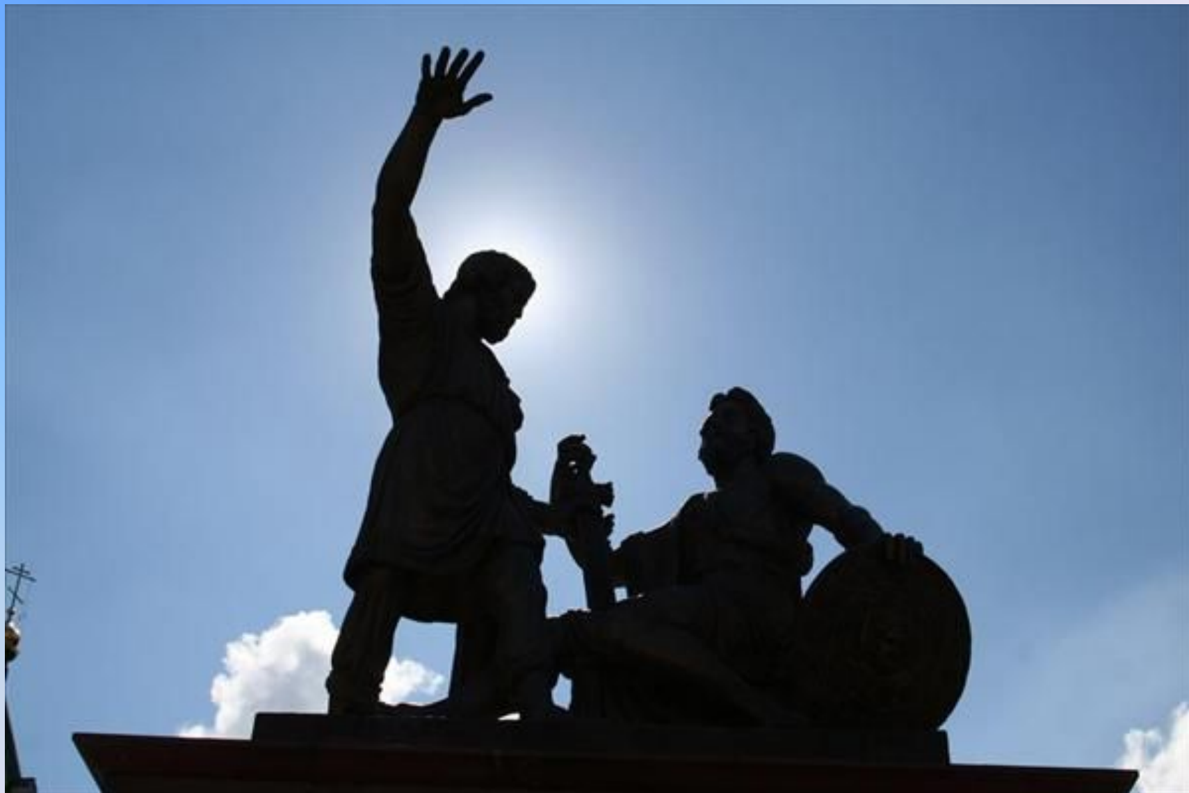
Памятник Минину и Пожарскому