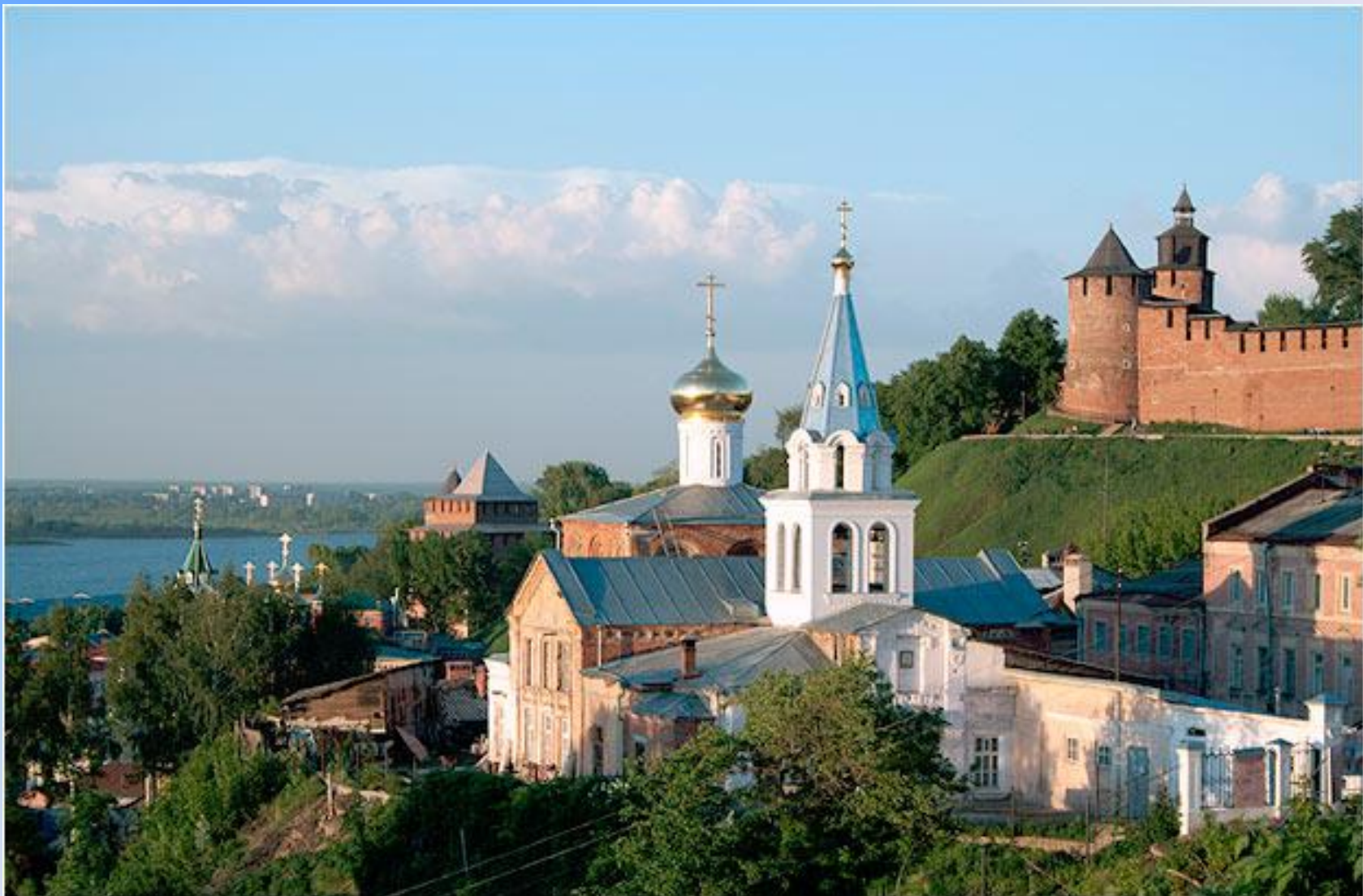
Церковь Ильи Пророка