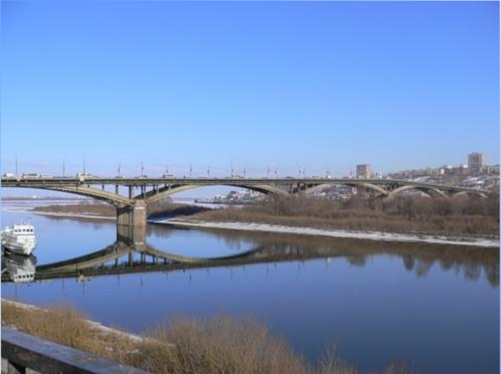
Мост через Волгу и Оку