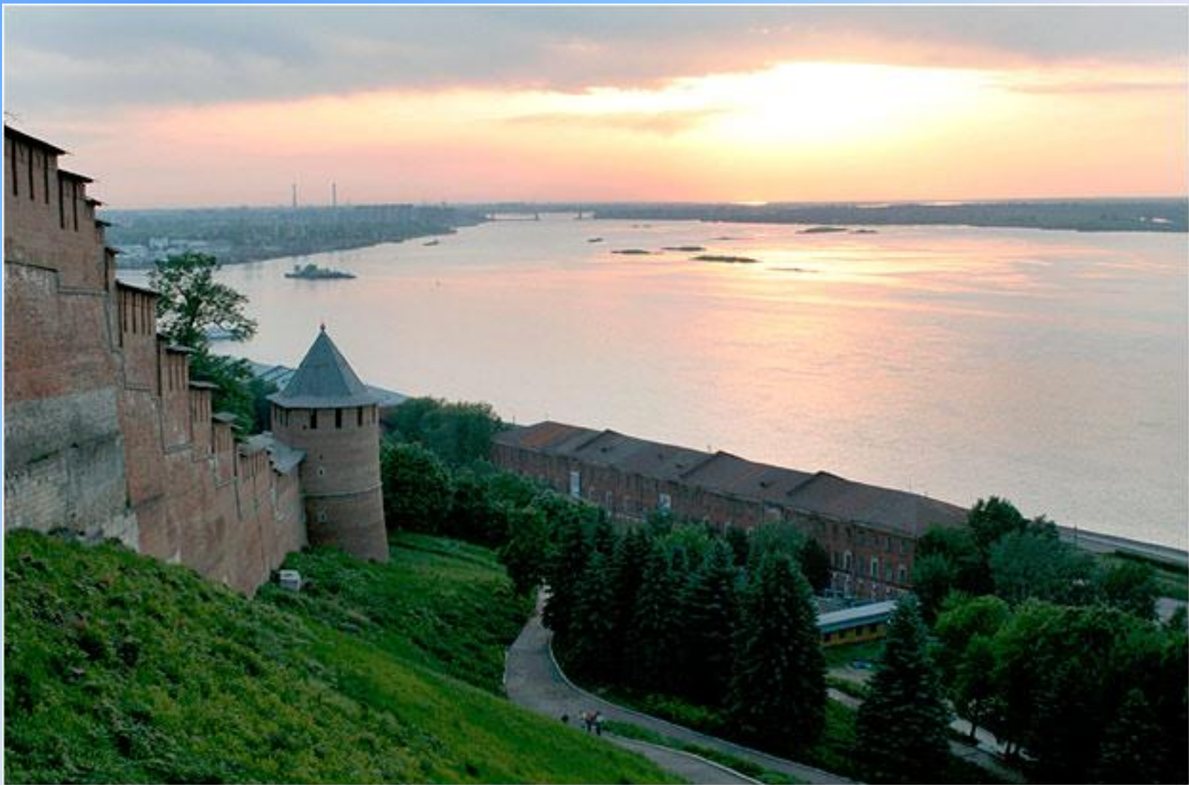
Кремль. Спуск к улице Рождественской