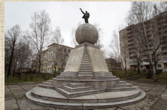
Памятник В. И. Ленину