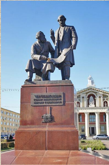
Памятник Черепановым — основателям российского паровозостроения