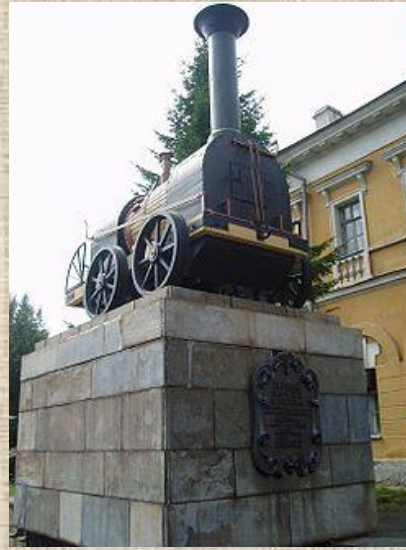
Первый паровоз Черепановых