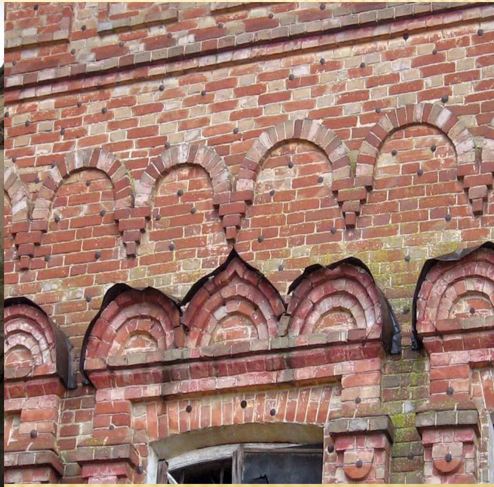
Крепления мозаичной кладки к деревянной основе