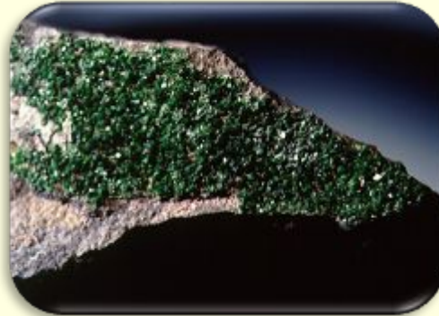
Минерал уварит- изумрудно зелёный гранат