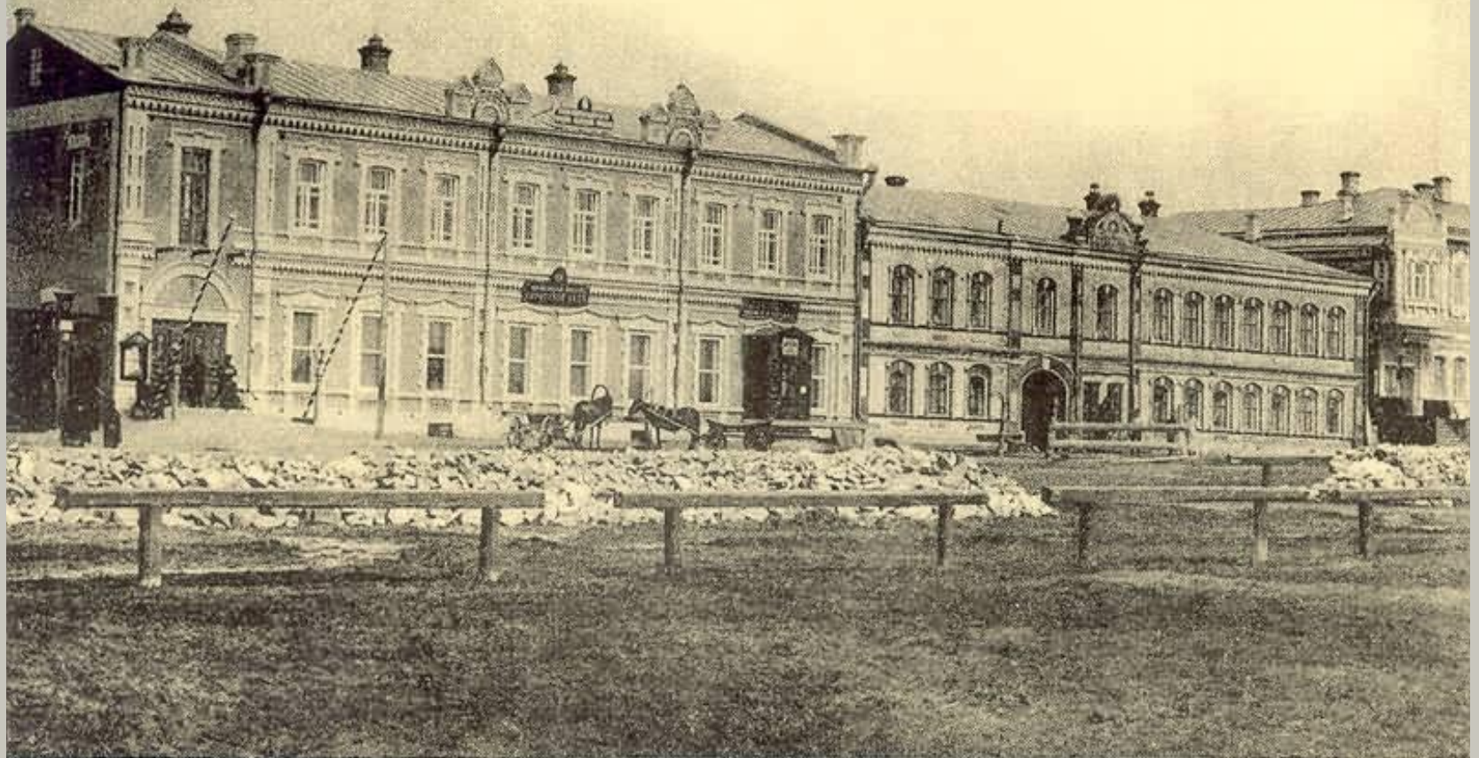
Новониколаевскъ Томск. губ. № 21. Зданіе Городскаго Управленія.