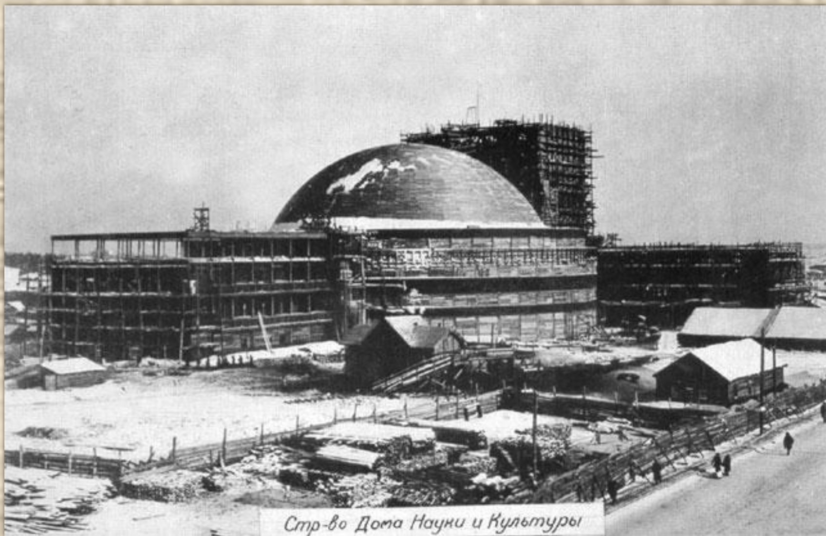
Стр-во Дома Науки и Культуры