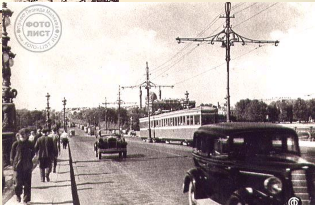
Ленинград в 30-е годы 20 века