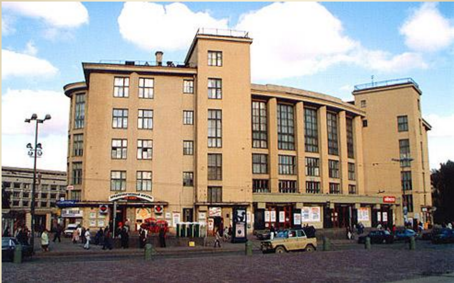
Дворец Культуры им. А.М. Горького