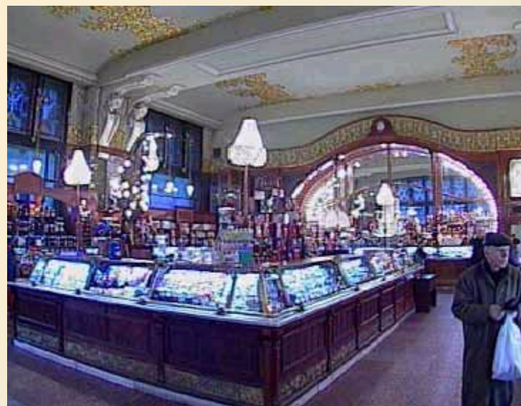
Елисеевский магазин или Гастроном № 1