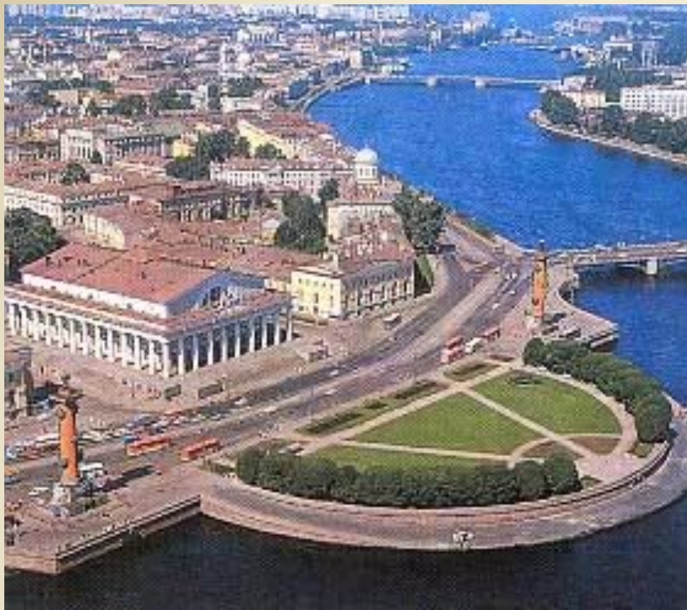
Сквер на Стрелке Васильевского острова