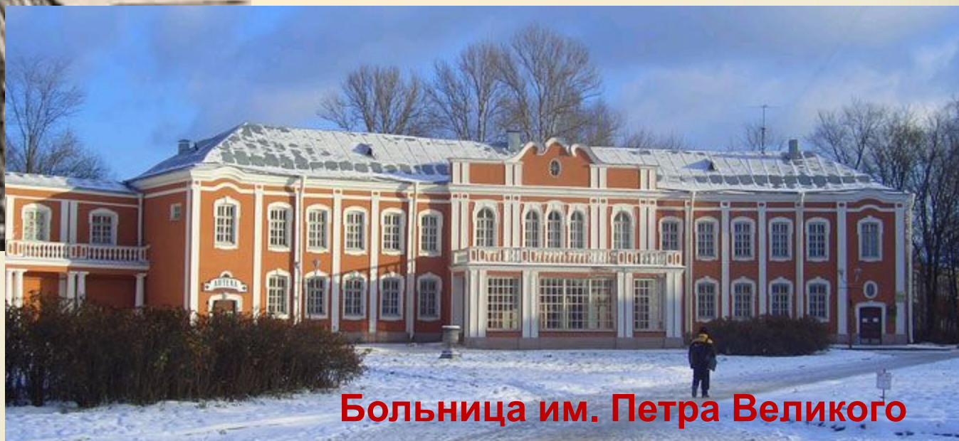
Больница им. Петра Великого