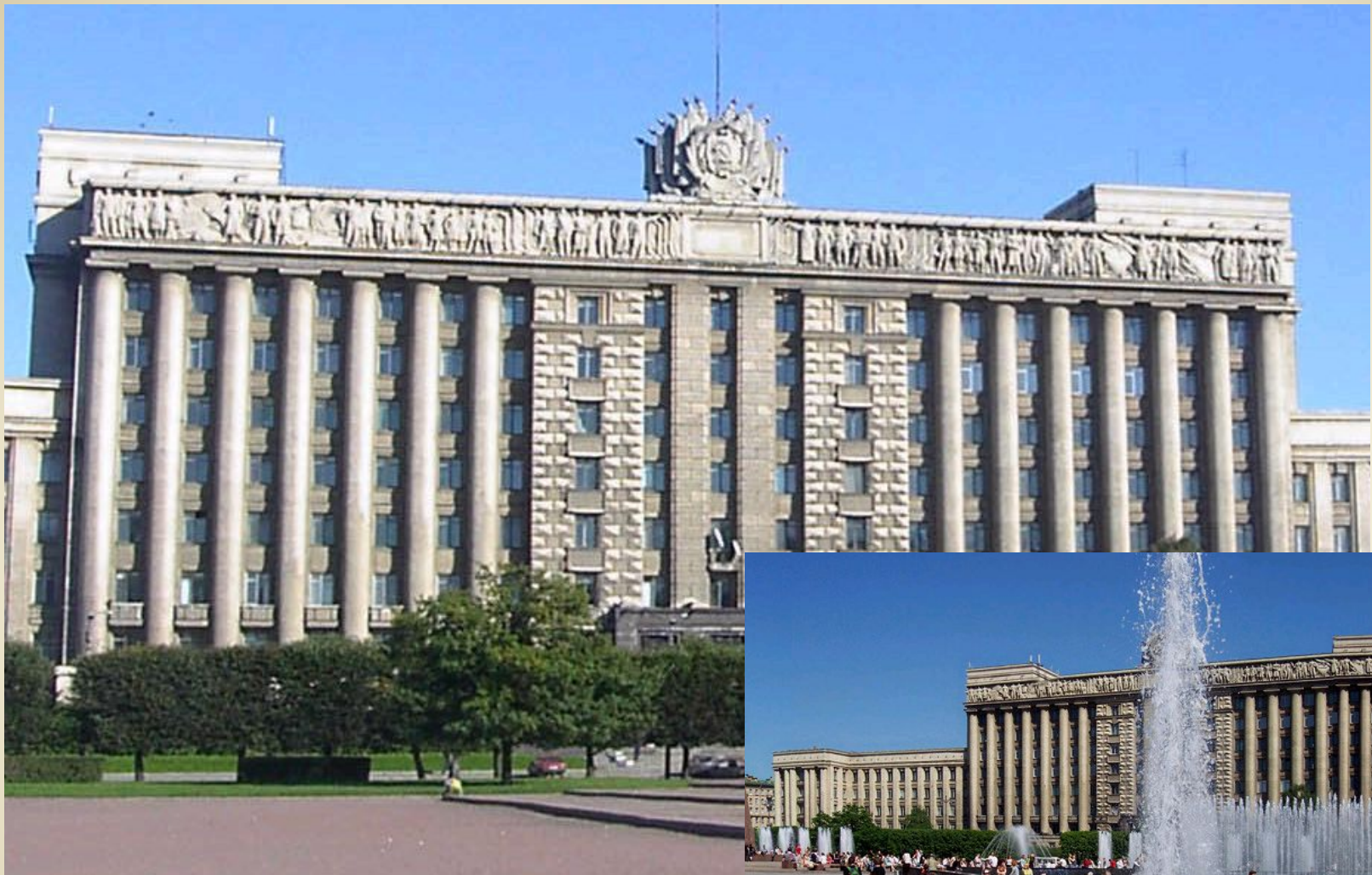
Дом Советов на Московской площади