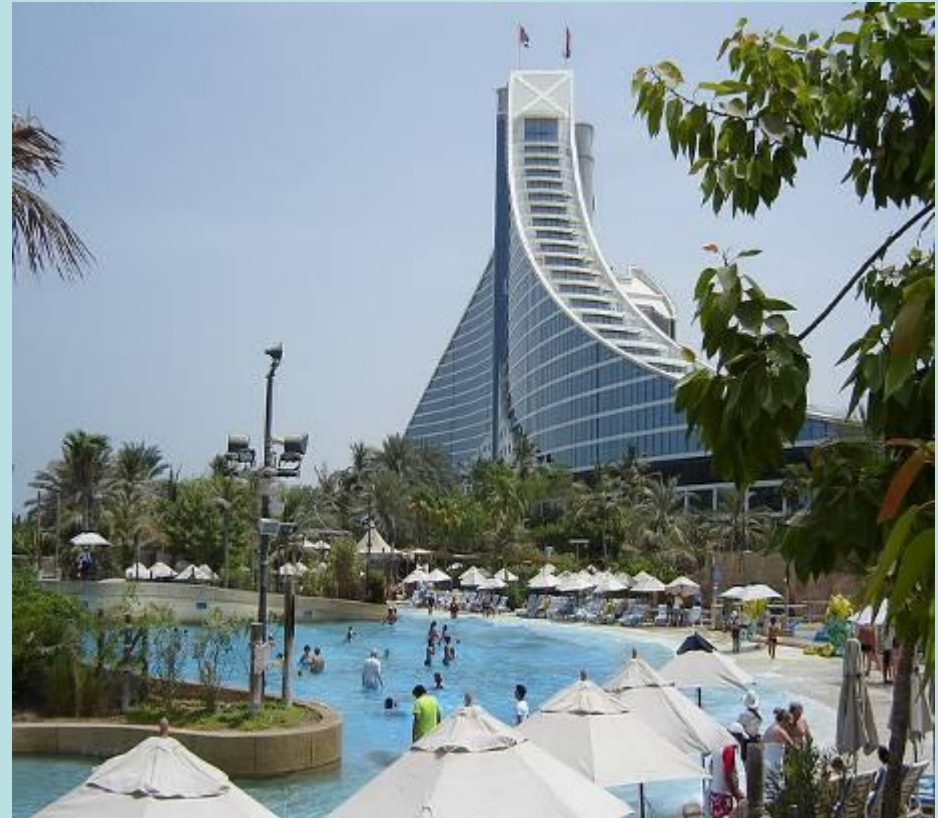
Вверху: Jumeirah Beach Hotel