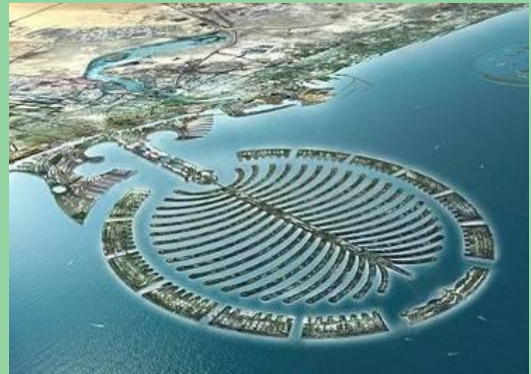
The Emerald Palace Residence