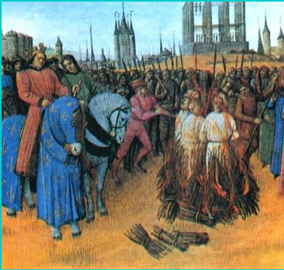
Сожжение еретиков. Средневековая миниатюра.

За 10 лет его «великого инквизиторства» на кострах сгорели 10 000 людей.