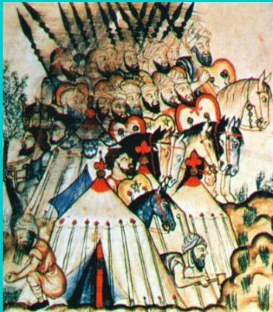
Войско мавров. Средневековая миниатюра.

Испанцев поддержали итальянцы и французы.