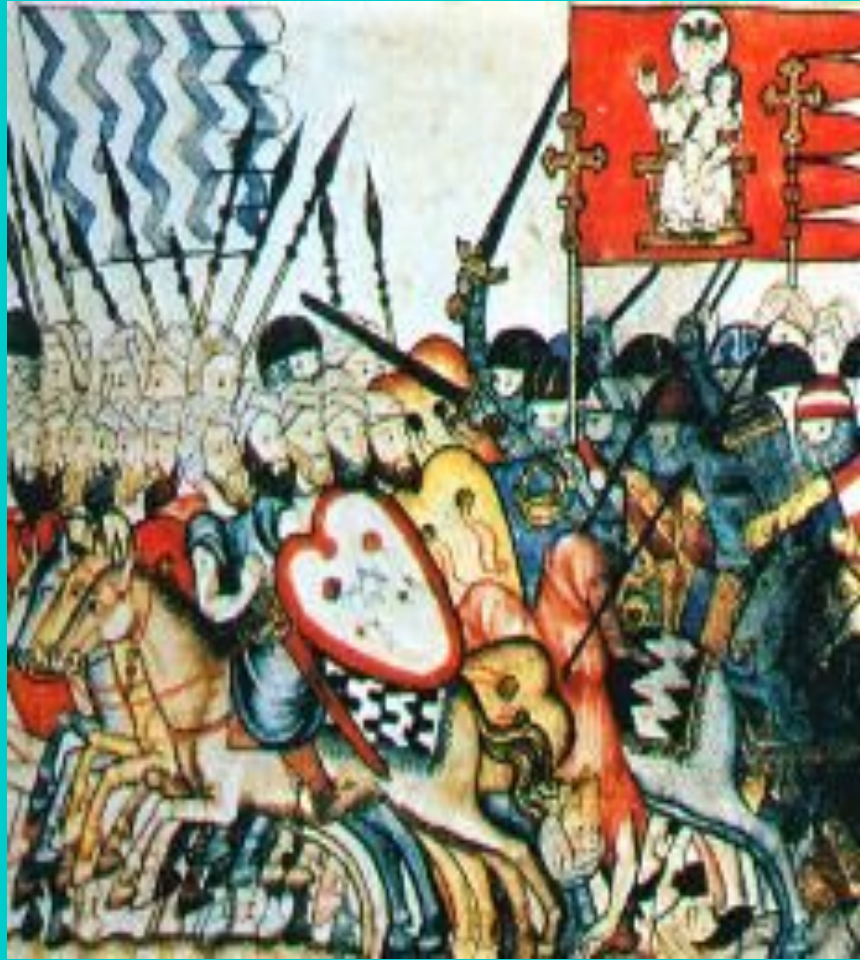
Войско Альфонса X Мудрого в походе. Средневековая миниатюра.

В 10 в в Испании началась Реконкиста -отвоевание земель захваченных му- сульманами.