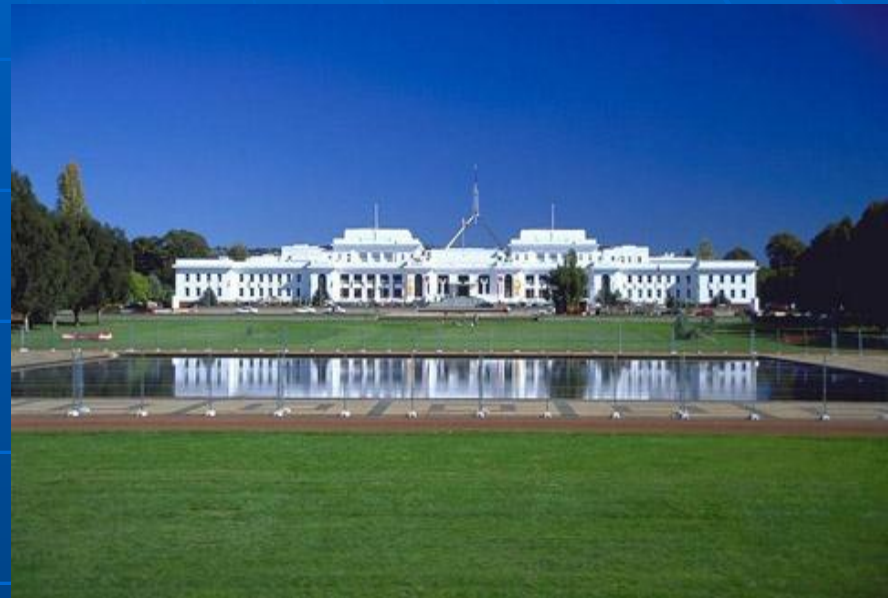
Парламент Австралии. Канберра

Полное наименование - Содружество Австралия. Государственный строй – федеральное парламентское государство. В состав федерации входят 6 штатов: Новый Южный Уэльс, Южная Австралия, Западная Австралия, Квинсленд, Тасмания, Виктория, а также 2 территории: Территория федеральной столицы Австралии и Северная Территория. Содружеству принадлежат острова Ашмор и Картье, остров Рождества, Кокосовые (Килинг) острова, Коралловые морские острова, острова Херд и Мак-Дональд, остров Норфолк. Столица - Канберра. Независимость Австралия получила 1 января 1901 г., в то же время страна продолжает оставаться членом Британского Содружества. Австралия является членом ООН. Законодательство основано на английском общем праве. Исполнительная власть находится в руках британского монарха, генерал-губернатора и премьер-министра, возглавляющего Кабинет Министров. Двухпалатный федеральный парламент состоит из Сената(60чел.) и Палаты представителей (123чел.). Главные политические партии: Австралийская лейбористская партия (АЛП), Либеральная партия Австралии, Национальная партия Австралии, Партия австралийских демократов.