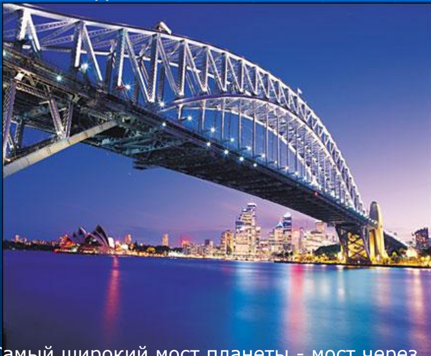
Самый широкий мост планеты - мост через сиднейскую гавань