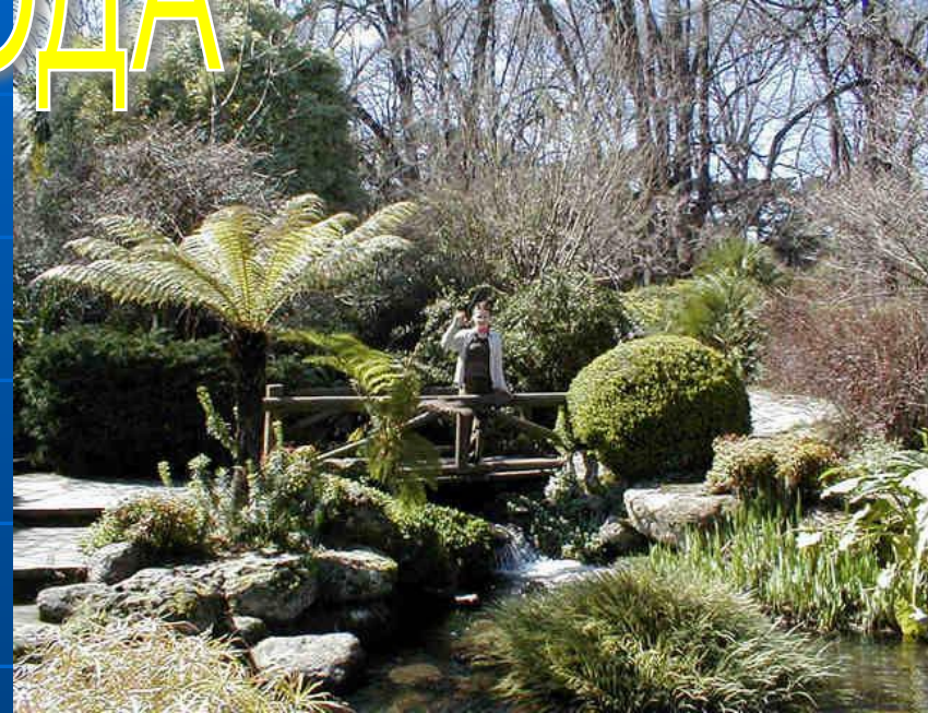
Парк Фицрой находится в черте города

Австралия это страна занимающая целый континент, поэтому неудивительно что природа здесь очень и очень разнообразна. Даже если просто путешествовать в радиусе 200 км от Мельбурна, мы увидим непроходимые дремучие леса, гигантские папоротниковые деревья, водопады, горы, бескрайние холмы и равнины австралийского аутбека.