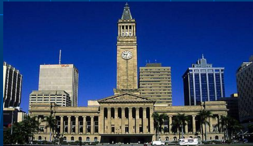
Ратуша в Брисбене