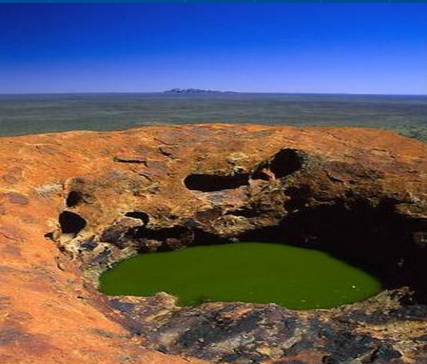
Зеленое озеро на Улуру

В Австралии самые популярные курорты находятся на восточном побережье. Самый известный из них - Золотой Берег с морским парком и отличными условиями для серфинга. В столице действует множество музеев. Среди них необходимо упомянуть Музей Австралии, Национальный морской музей, Музей античности Николсона. В Мельбурне находится Национальная галерея Виктории. Здесь же примечательны Королевский ботанический сад и Национальный гербарий.