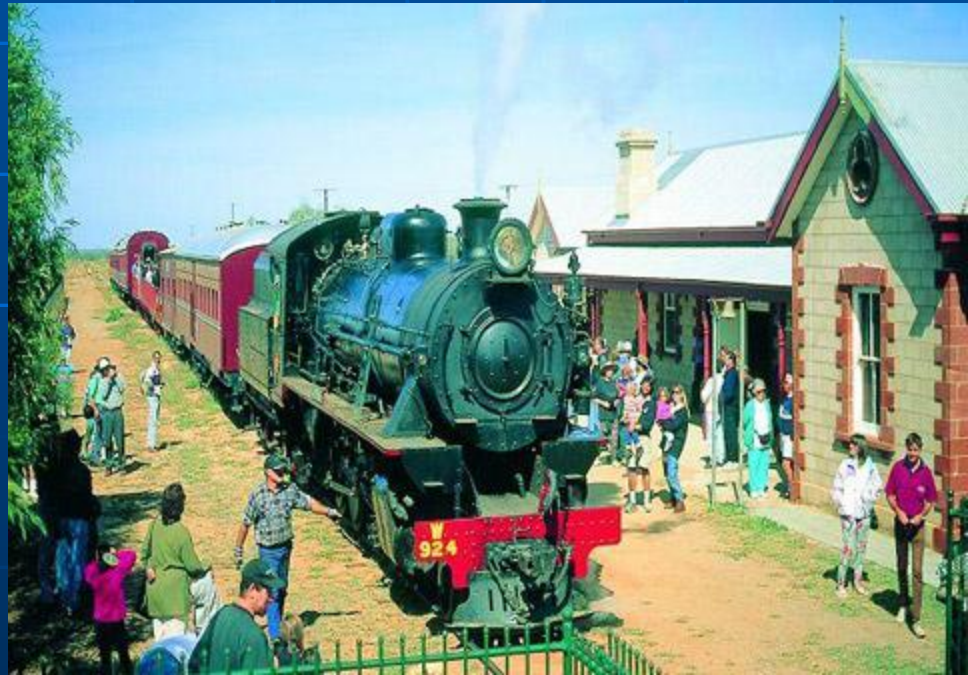
Туристический поезд - достопримечательность Элис Спрингс