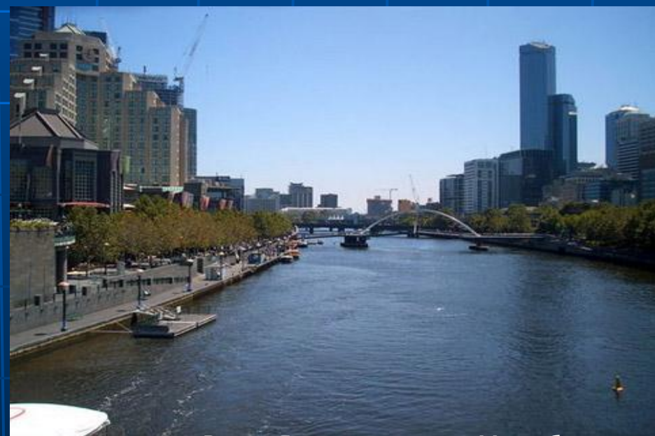
Река Ярра в центре Мельбурна