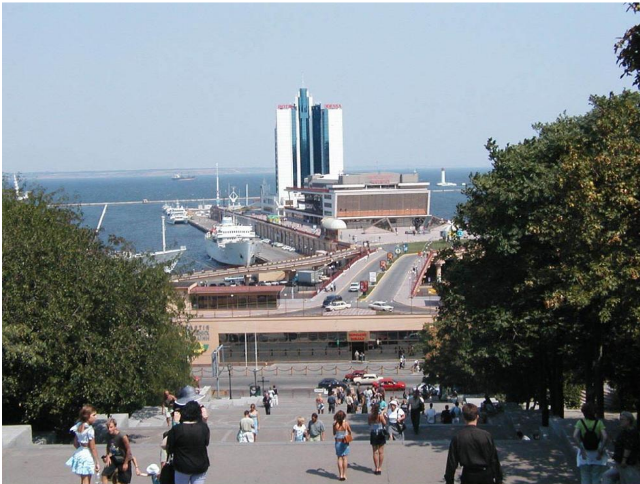
Морской вокзал Maritime Passenger Terminal