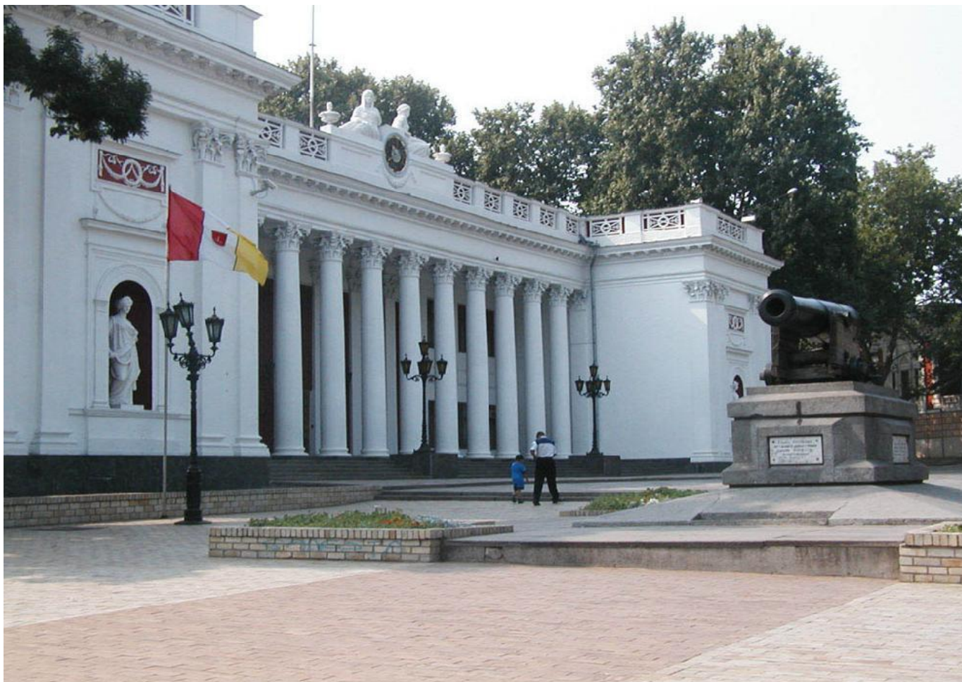
Городская мэрия City Hall