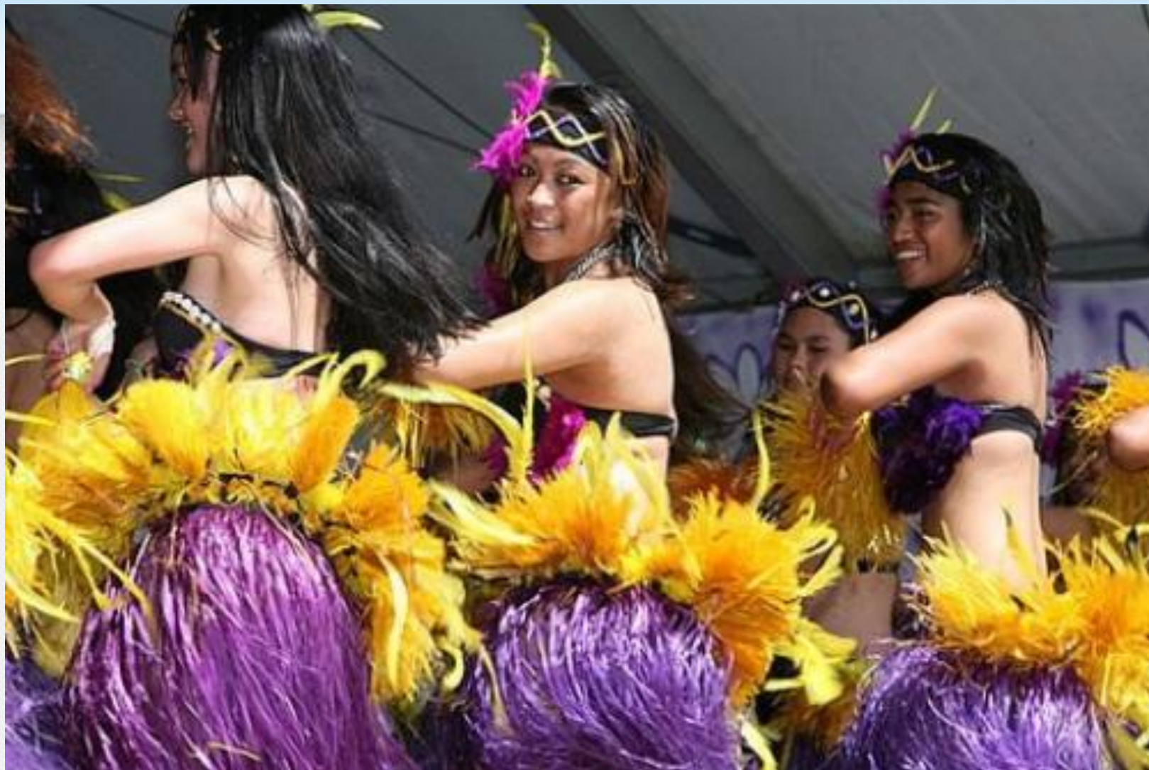
Танцовщицы с острова Кука