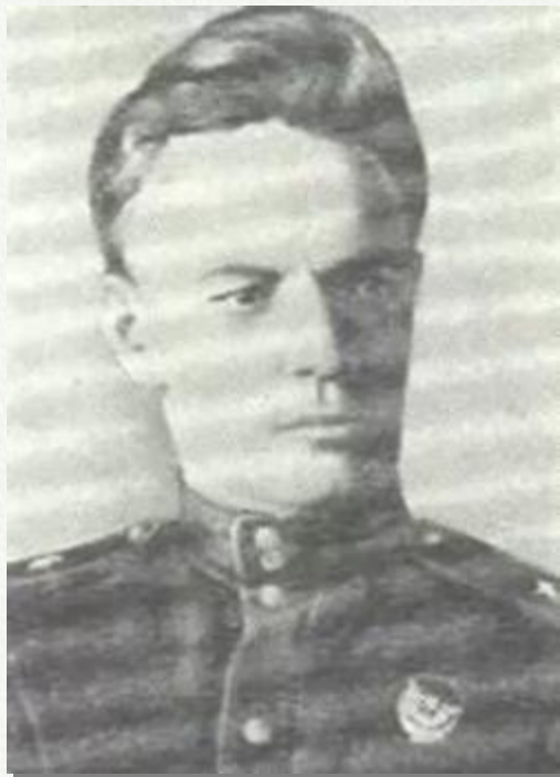
Гвардии генерал - майор Б.Н. Аршинцев