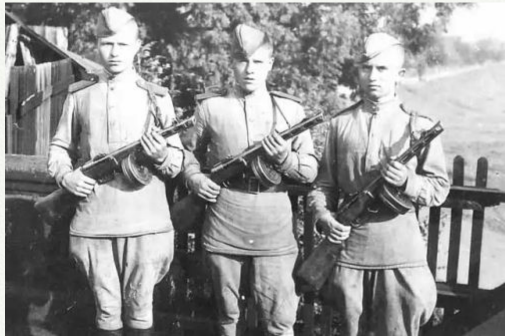
Воины 30 –й Иркутской дивизии