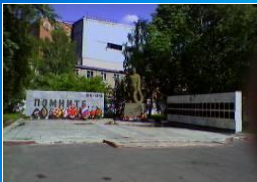
мемориал павшим в годы ВОВ