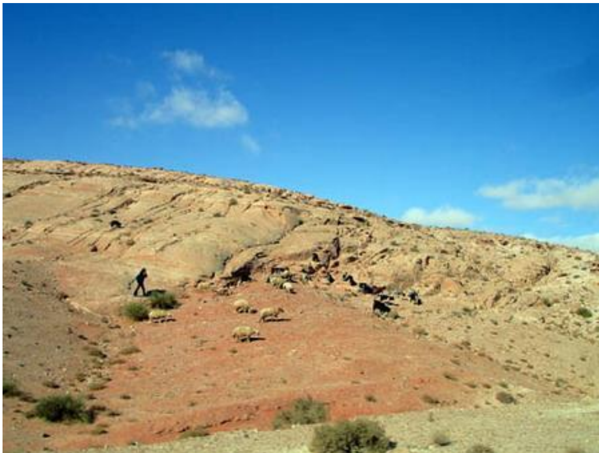
Пустыня Вади Рам