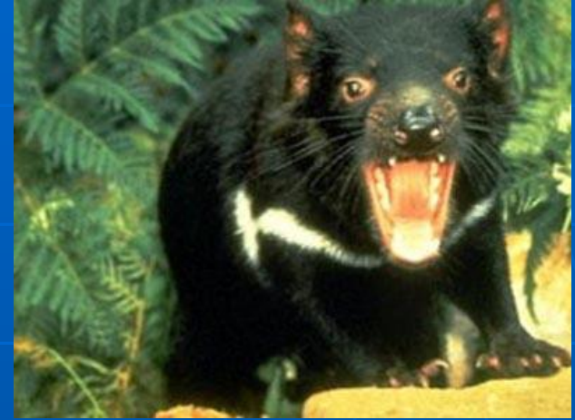
тасманийский сумчатый дьявол

162 вида животных – сумчатые животные (донашивают детенышей в сумке, складка на животе)