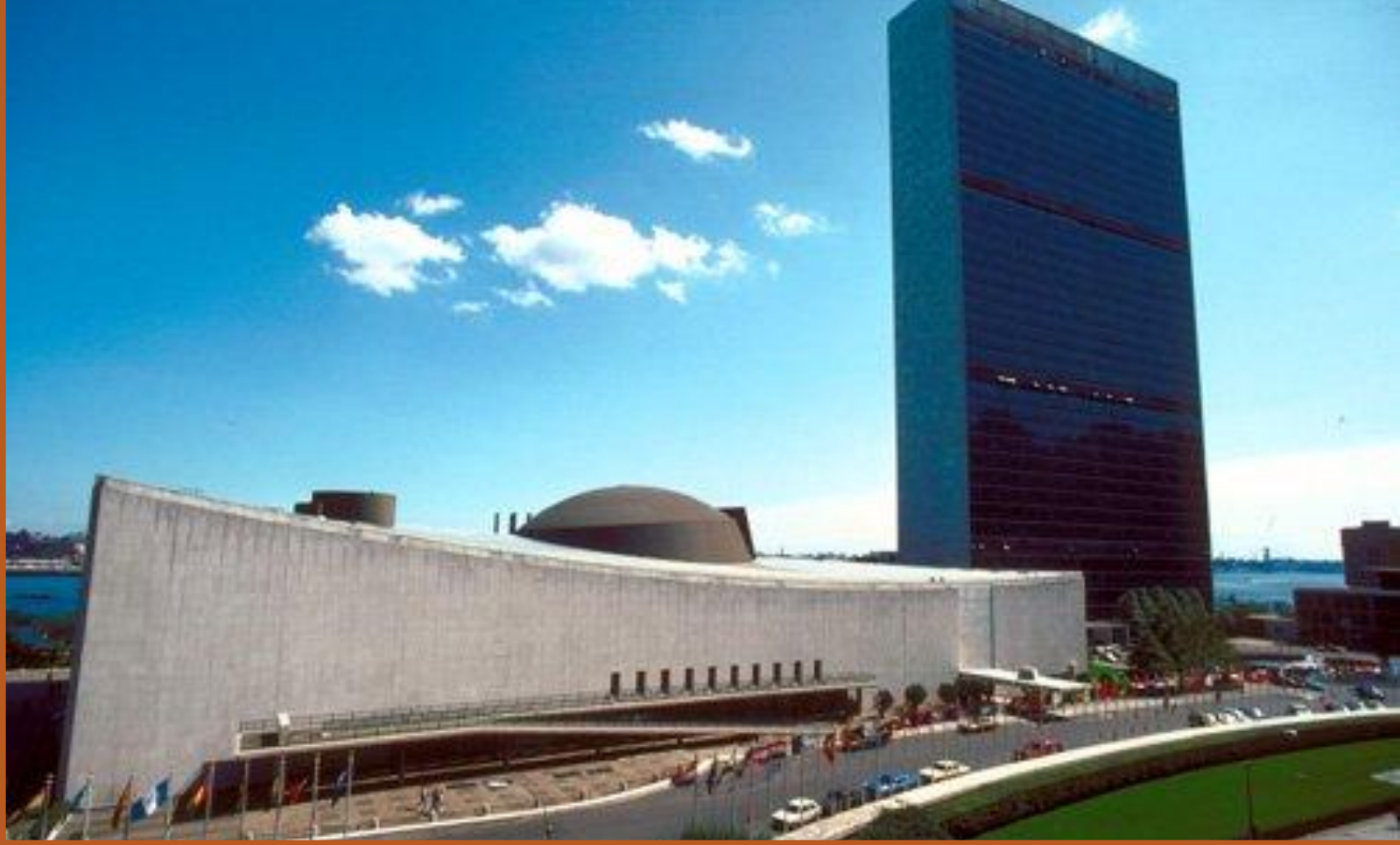
Штаб-квартира ООН в Нью-Йорке (США)