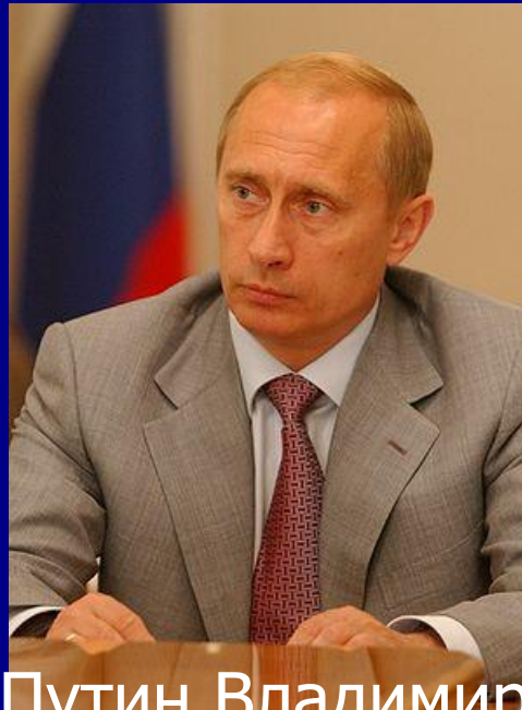
Путин Владимир Владимирович