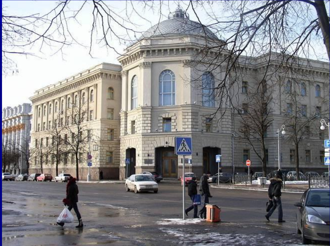
Здание Исполкома СНГ в Минске

Постоянно действующий орган СНГ — Исполком СНГ в Минске (Белоруссия)