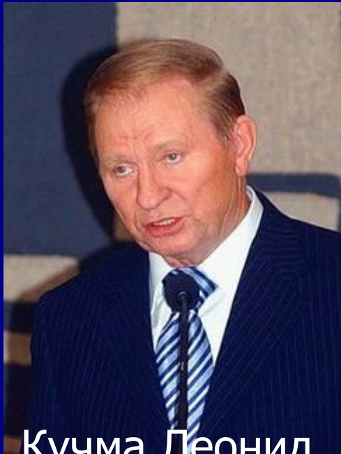
Кучма Леонид Данилович