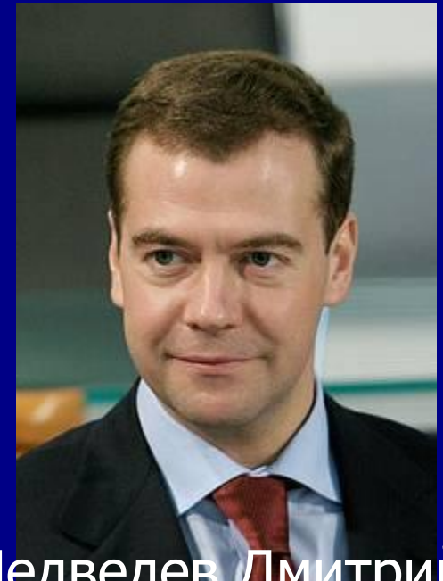
Медведев Дмитрий Анатольевич (с 2010)