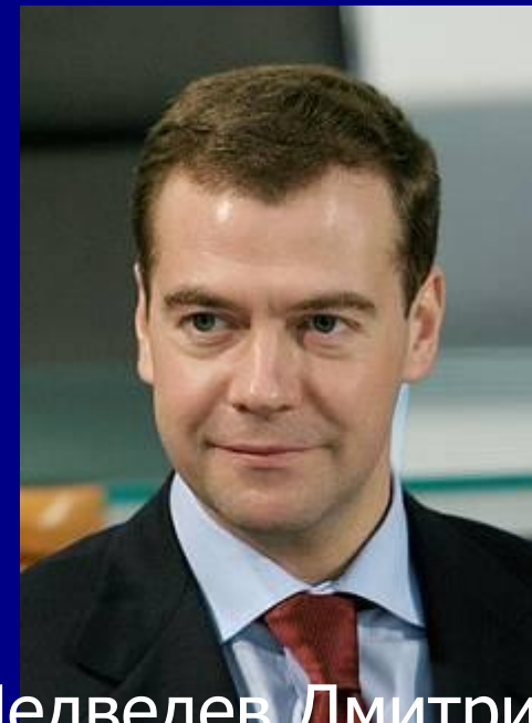
Медведев Дмитрий Анатольевич (с 2010)