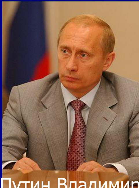
Путин Владимир Владимирович