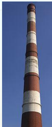
Кураховская ТЭС, вид с северо-востока