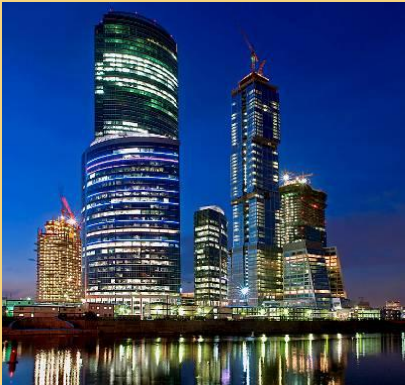
Москва – город федерального подчинения