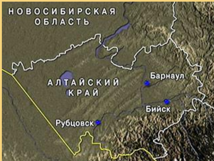
Города Алтайского края