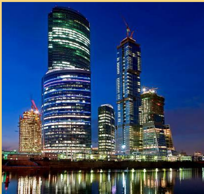
Москва – город федерального подчинения