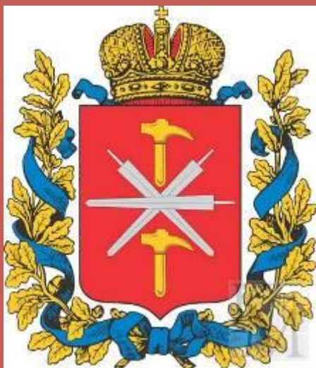
Герб Тульской губернии