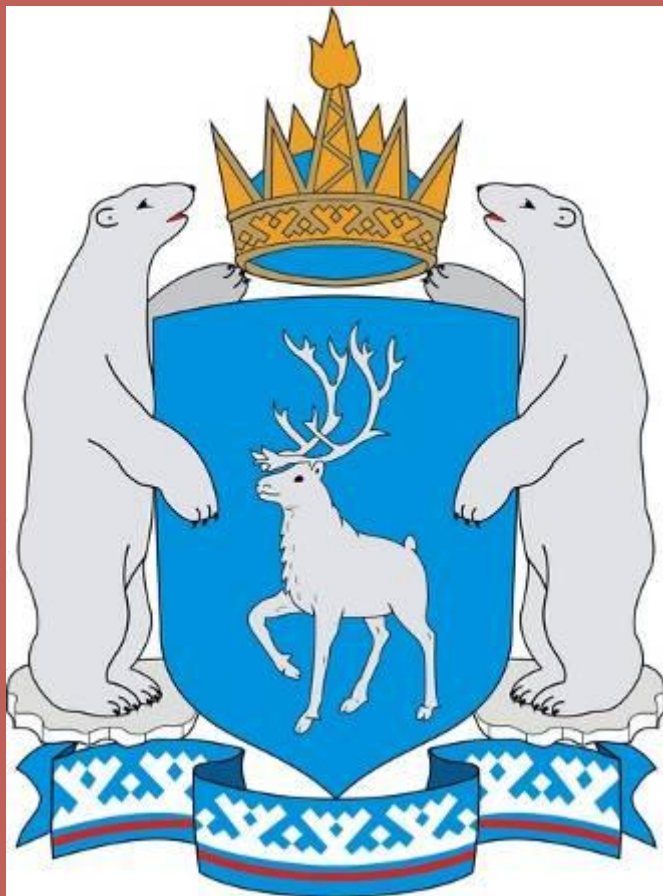
Ямало-Ненецкий автономный округ