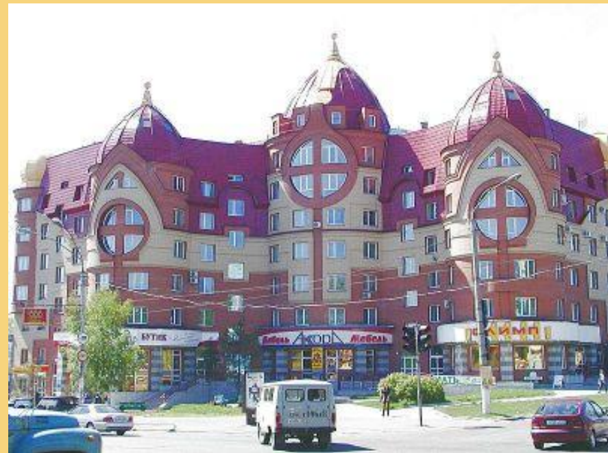
Барнаул – центр Алтайского края