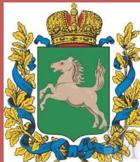
Герб Томской губернии