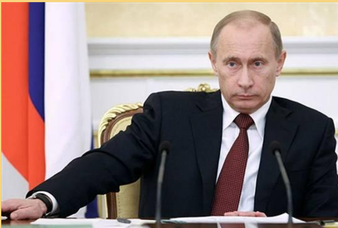
Президент РФ Владимир Путин