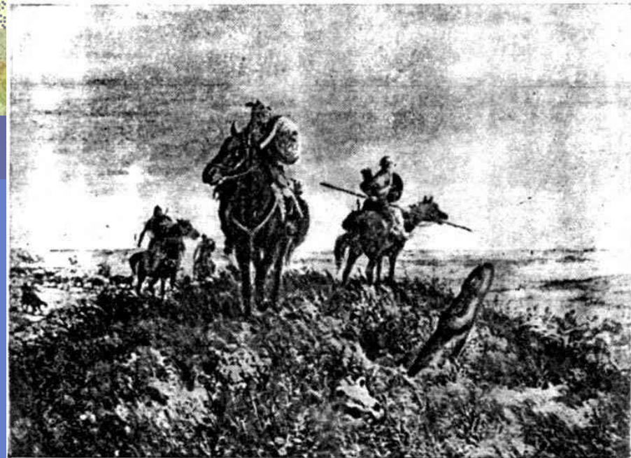
Набег кочевников (с карт. худ. Зубарева).

Горы защищали от набегов кочевников (прекратились к 1000 г.)