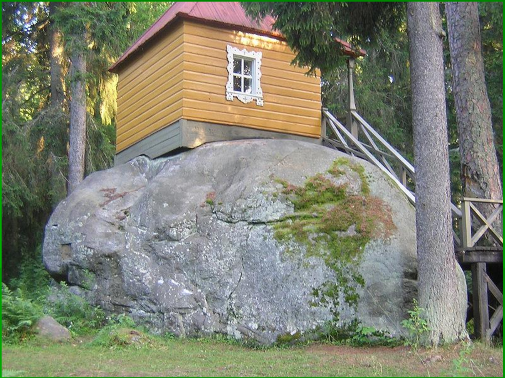
Конь- камень (Коневец)