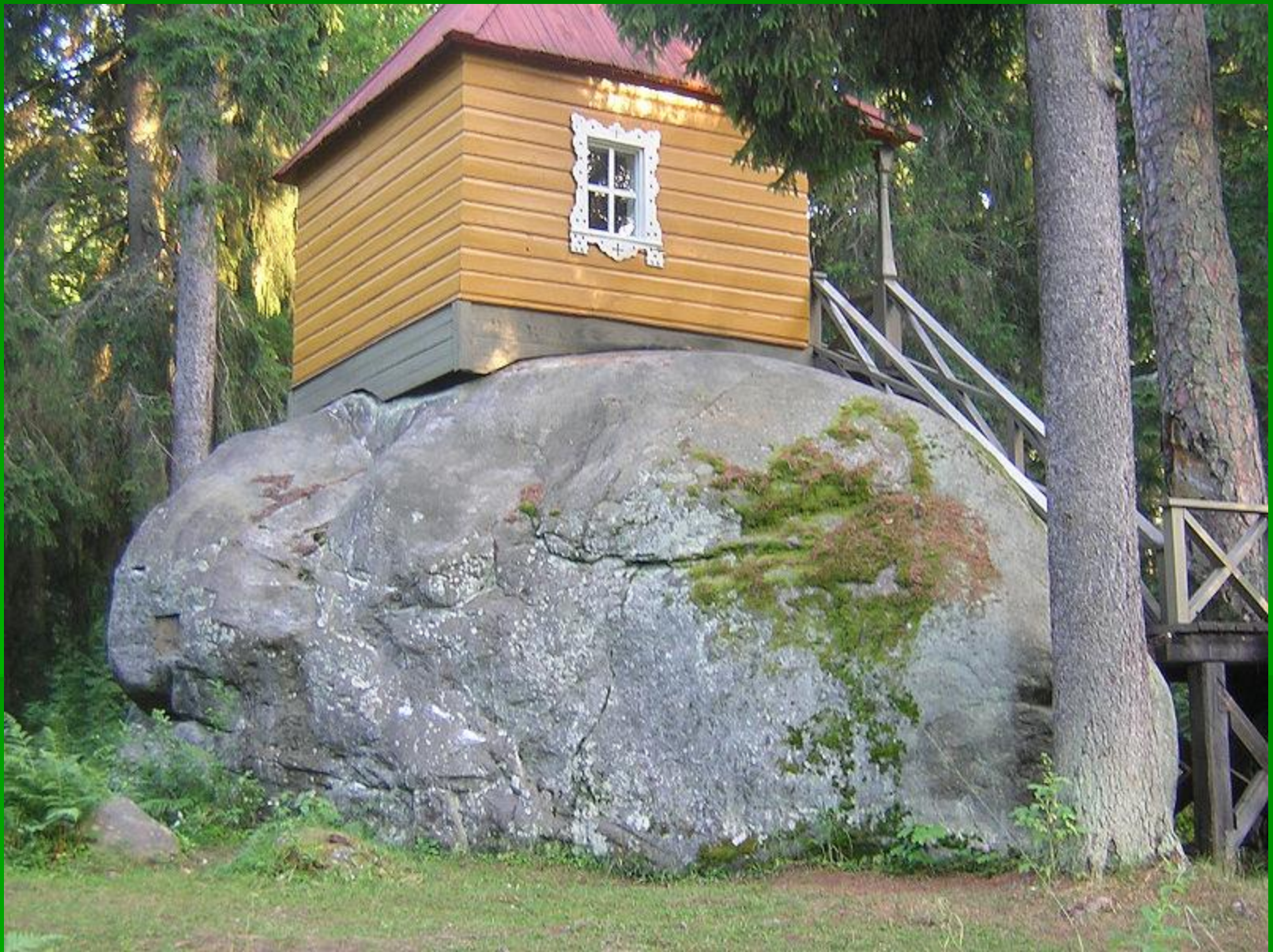
Конь- камень (Коневец)