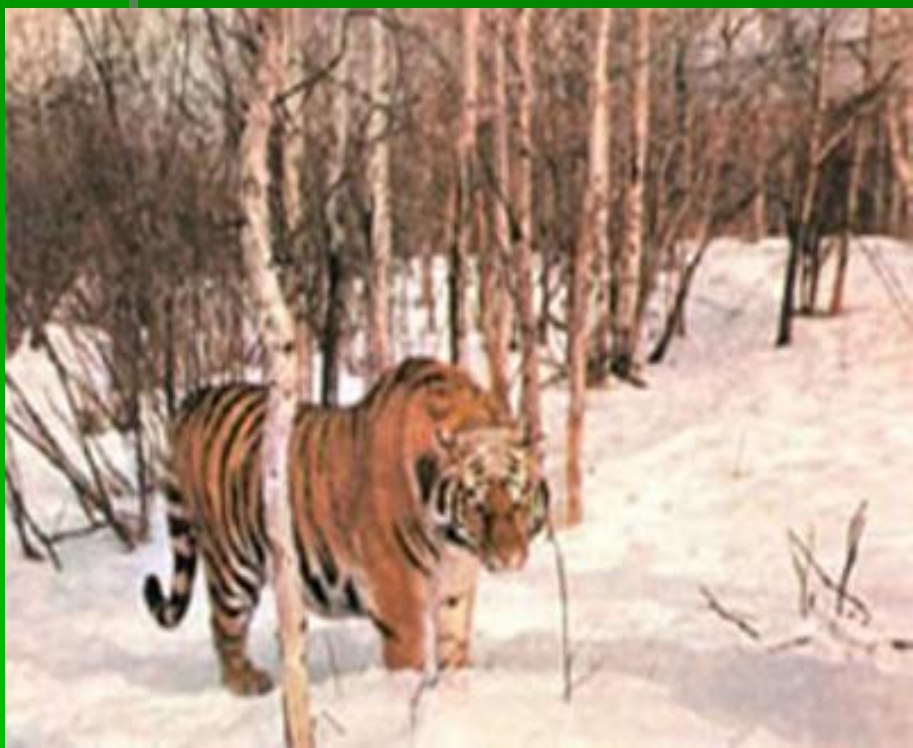
Фильм: «Уссурийский заповедник»

До этого известны примеры неофициальных заповедников: Супутинский на Дальнем Востоке (1911г.), с 1913 г. – Уссурийский, Саянский (1916), Кедровая падь (1916).