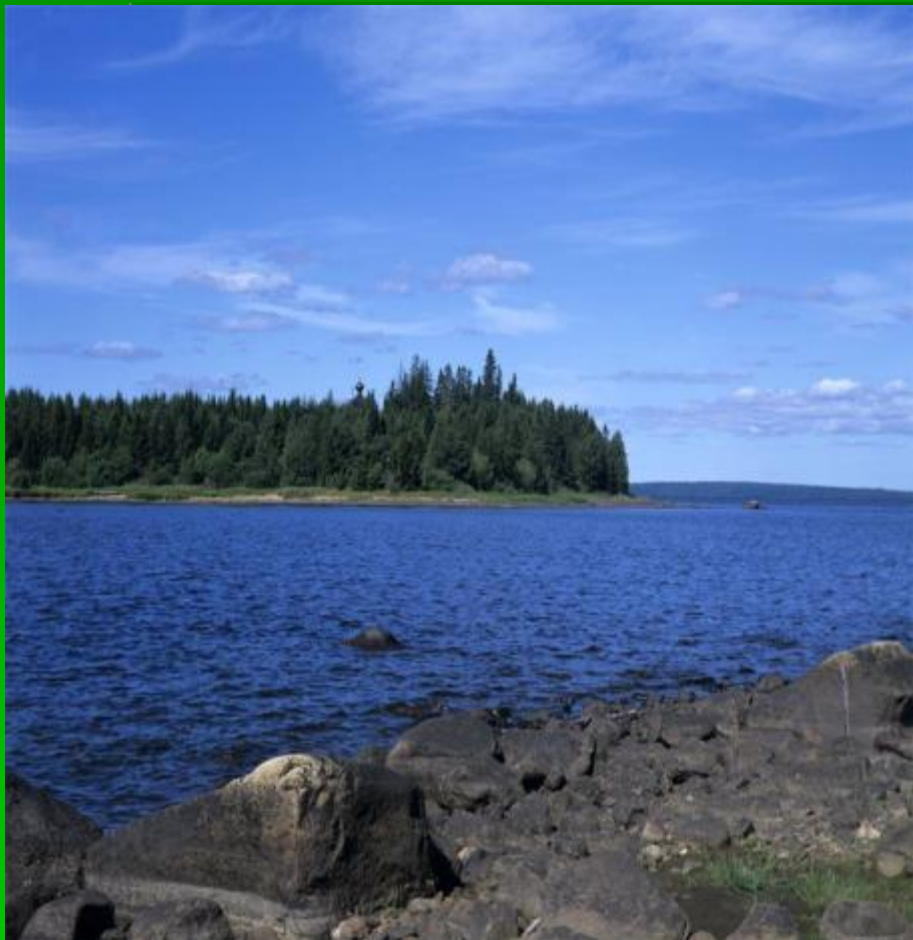
Водлозерский Национальный парк

Национальный парк – это территория или акватория с малонарушенными природными комплексами и уникальными природными объектами. В России 35 национальных парков.