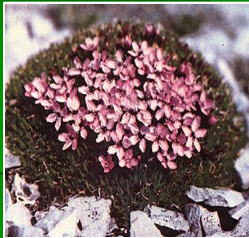
Фильм: «Большой Арктический заповедник»