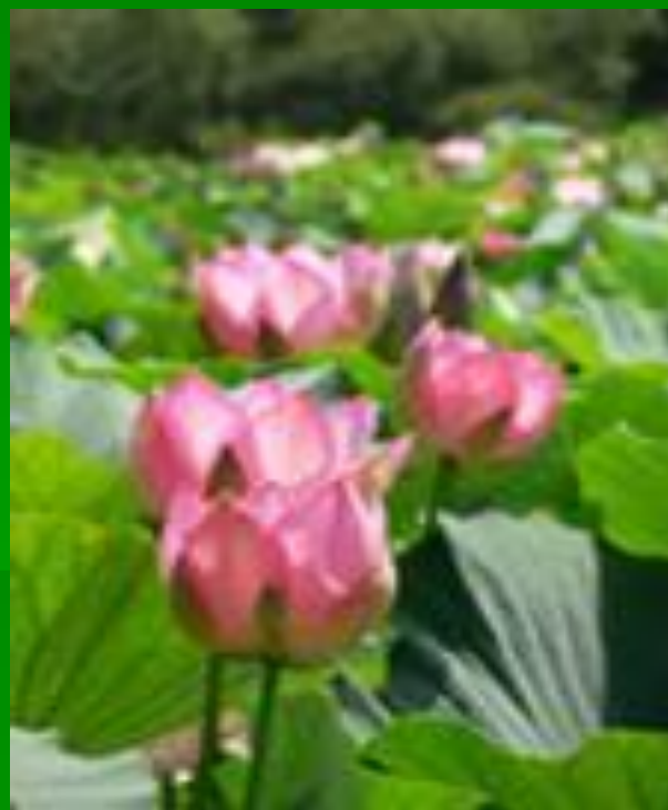
Фильм: «Астраханский заповедник»

Первый советский заповедник – Астраханский – учреждён 11 апреля 1919г.