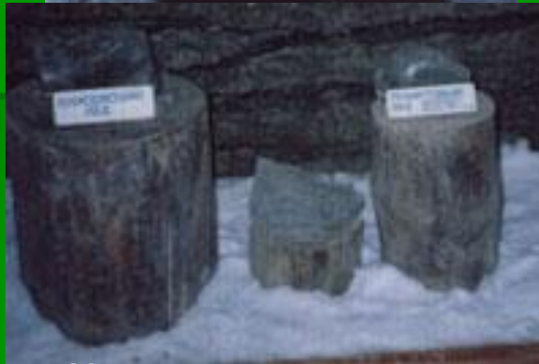
Музей вечной мерзлоты