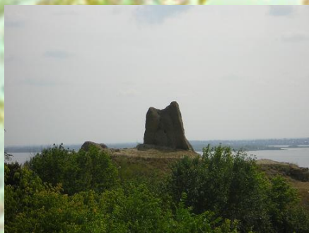
Останец «Три Монаха»