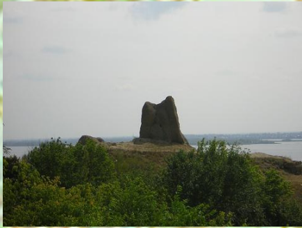
Останец «Три Монаха»