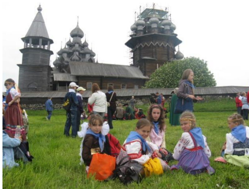
Кижский архитектурный ансамбль