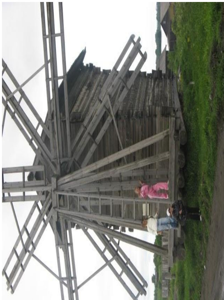
Ветряная мельница из д.Вороний Остров, 1921г.