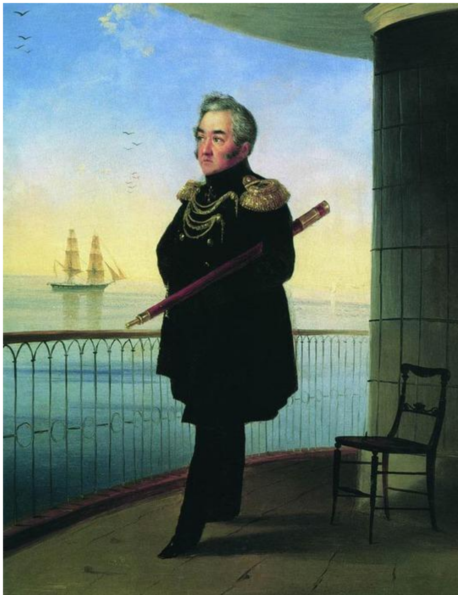
Адмирал Лазарев. Его учениками были Истомин, Корнилов, Нахимов.