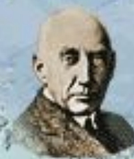
Р. Адмунсен 1912 г.