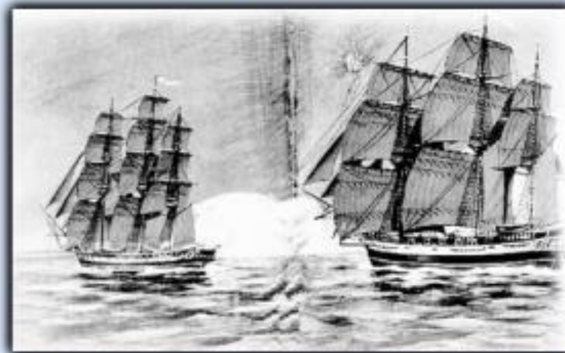
Шлюпы Восток и Мирный