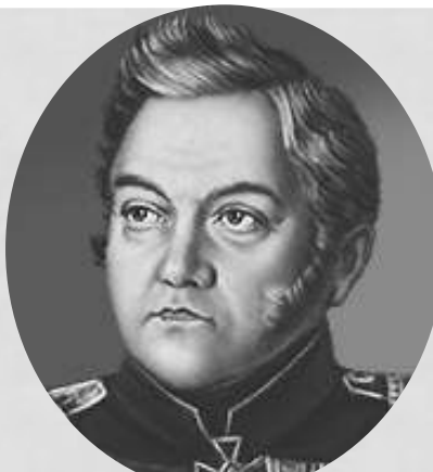
Михаил Петрович Лазарев