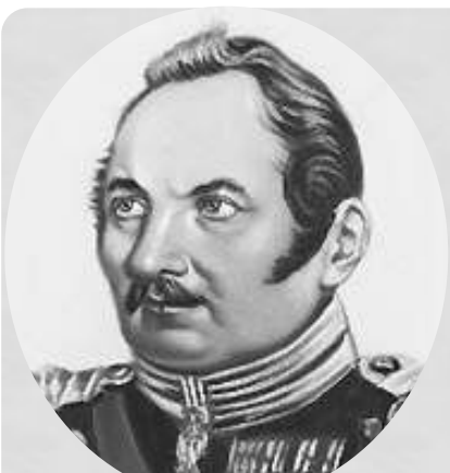
Фаддей Фаддеевич Беллинсгаузен