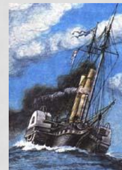
Колесный пароход фрегат "Тамань" 1849 г.