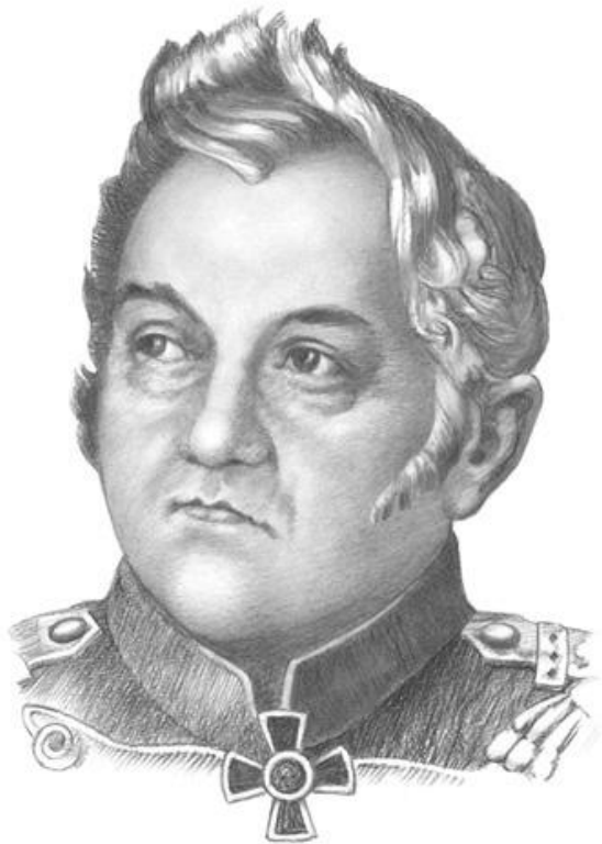
Михаил Петрович Лазарев 1788—1851

Командир шлюпки "Мирный" М.П.Лазарев родился в 1788г. во Владимирской губернии. Вместе с двумя братьями он также поступил в Морской корпус. Во время обучения он впервые побывал в море и полюбил его навсегда.