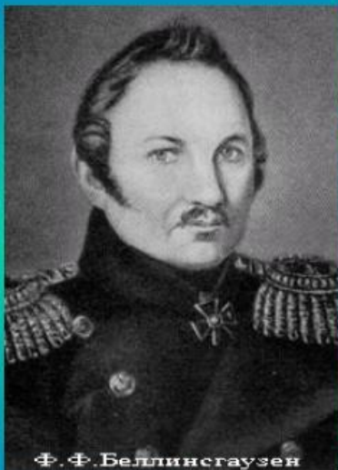
Ф. Ф. Беллинсгаузен