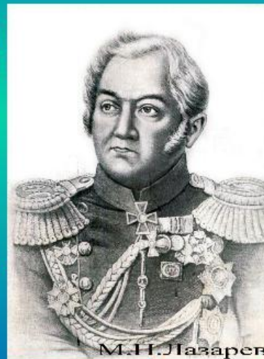
М. П. Лазарев

В 1819 году русские моряки Ф.Ф.Беллинсгаузен и М.П.Лазарев на военных шлюпах «Восток» и «Мирный», посетили Южную Георгию и попытались проникнуть в глубь Южного Ледовитого океана. В первый раз, 28 января 1820 года, почти на меридиане Гринвича, они достигли 69^{\circ}21' ю. ш. и открыли собственно современную Антарктиду.