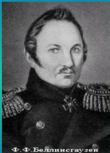
Ф. Ф. Беллинсгаузен