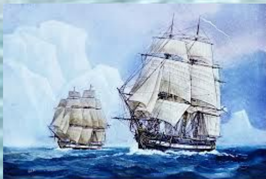
Шлюпы "Восток" и "Мирный" у берегов Антарктиды

Честь открытия шестого материка выпала русским мореплавателям .Два имени навсегда вписаны в историю географических открытий. Витус Беринг и Алексей Чириков летом 1825 года на шлюпах « Святой Петр» и « Святой Павел» снялись с якоря и под салюты артиллерийских береговых батарей покинули родную крепость Санкт – Петербург. Перед экспедицией стояла задача как можно дальше проникнуть на юг, чтобы окончательно разрешить вопрос о существовании Северного материка. 28 января 1826 года мореплаватели увидели ледяную стену , преградившую дальнейший путь на юг. Участники экспедиции были уверенные , что за льдами скрывается Южная Америка. Это подтвердило и множество полярных птиц появившихся над шлюпами.