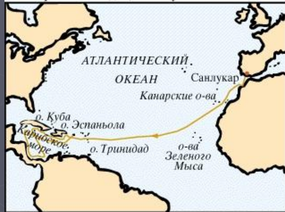
Четвертая экспедиция Колумба 1502–1504

В 1502 году в биографии Христофора Колумба было совершено четвертое путешествие. Он достиг берега Центральной Америки, доказав, что между Атлантическим океаном и Южным морем лежит материк.