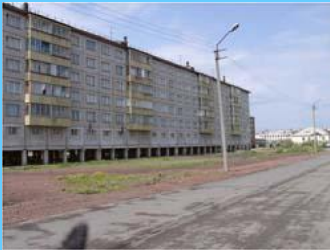
Дома на сваях в Норильске

Как повлияет потепление климата на площадь распространения многолетней мерзлоты? К каким последствиям это может привести?