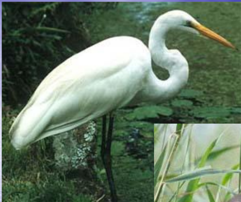
цапля белая малая