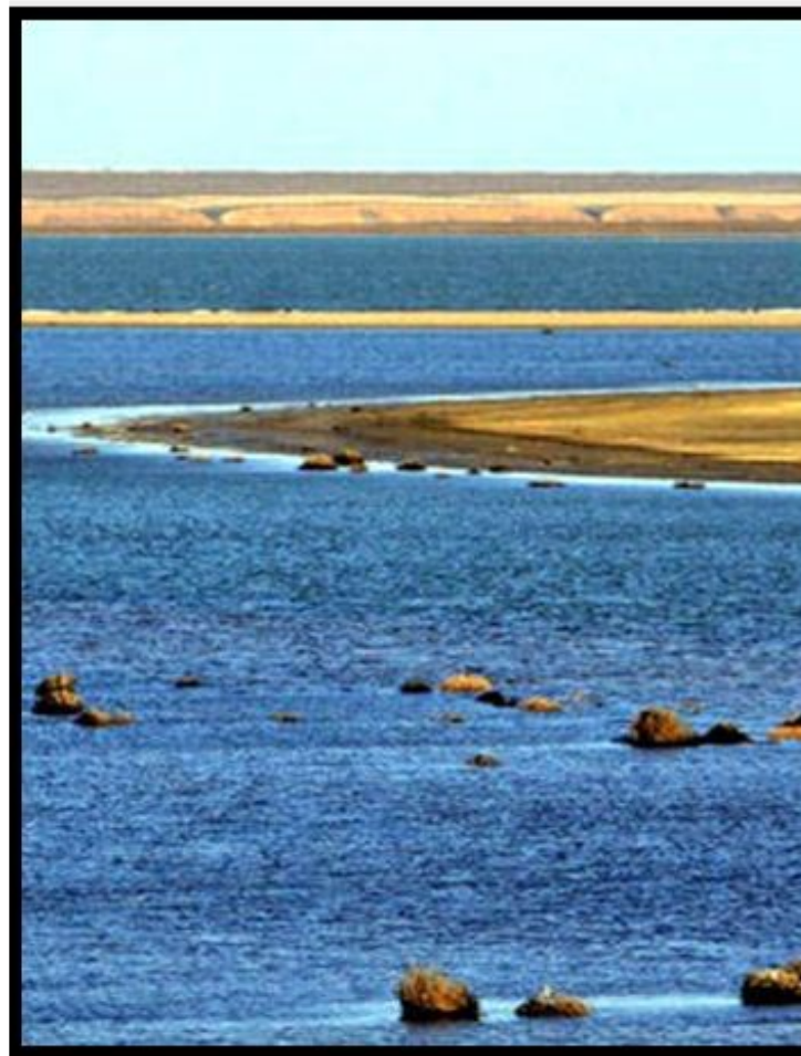
так выглядит в наше время.