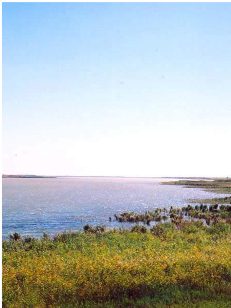
Так озеро выглядело 15 лет назад.